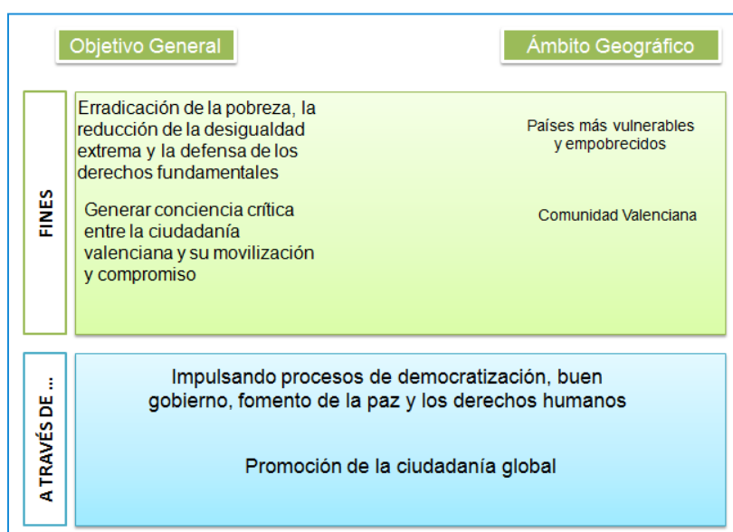
Ilustración 3. Objetivos generales del IV Plan Director de la Cooperación Valenciana

En cuanto a la coherencia del proyecto respecto a las acciones de la GVA referenciamos el análisis a las estrategias a nivel del Plan Director, así vemos que entre sus fines, y a nivel territorial de la Comunidad Valenciana, se encuentra el de generar una conciencia crítica en la población (ver siguiente ilustración), siendo el objetivo superior del proyecto que evaluamos el de “Promover en la Comunitat Valenciana una ciudadanía comprometida con la construcción de una sociedad global, solidaria, justa y equitativa, acorde con derechos humanos y con los Objetivos de Desarrollo Sostenible de la Agenda 2030, especialmente con el ODS 5”, para lo cual las acciones de sensibilización son un instrumento esencial.