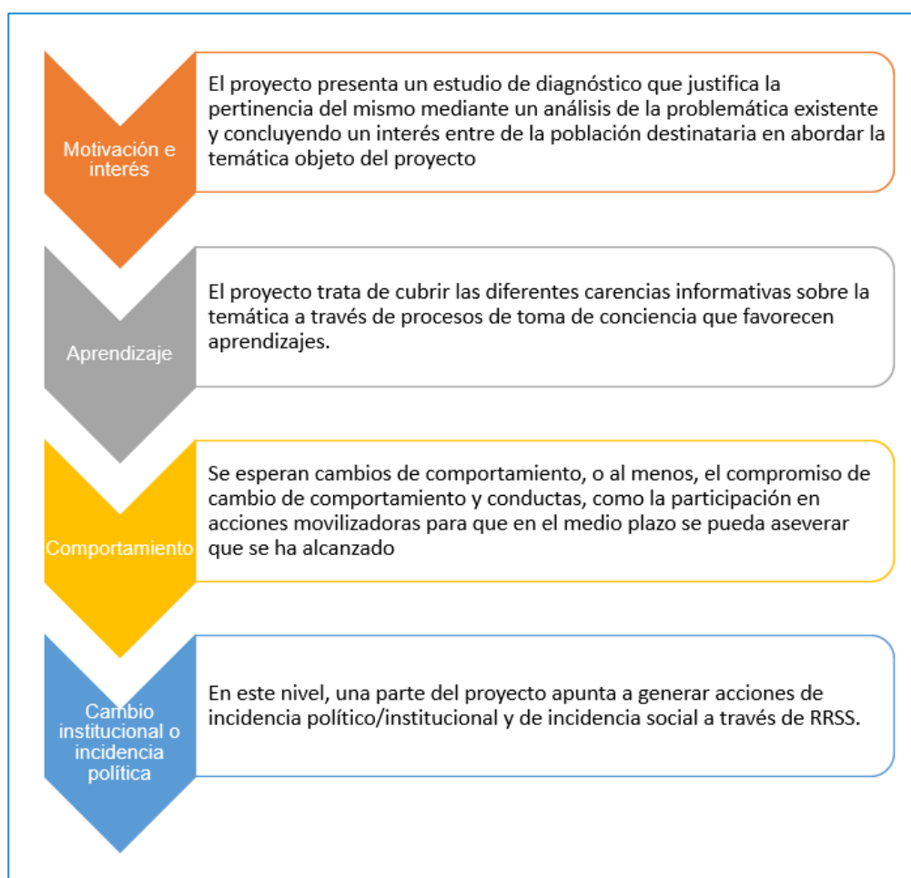
Ilustración 2. Contribución de los resultados según niveles del modelo de Kirkpatrick

Las fuentes de verificación combinadas de la MML del proyecto y de la MPS aportan la información suficiente y orientan el trabajo durante la ejecución y evaluación del proyecto.