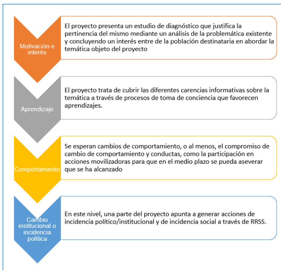
Ilustración 2. Contribución de los resultados según niveles del modelo de Kirkpatrick

La cadena de objetivos, resultados e indicadores, por tanto, tiene la lógica necesaria, y busca los niveles de transformación de acuerdo con el modelo teórico de Kirkpatrick que se muestra en la siguiente ilustración.