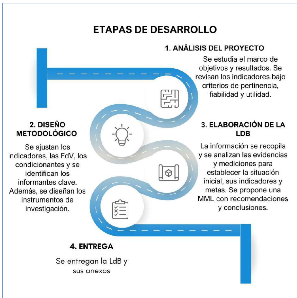
Ilustración 1. Etapas de desarrollo del trabajo

La planificación de la elaboración del informe de Línea de Base (LdB) empezó con un análisis inicial del proyecto, con un enfoque detallado en la Matriz de Marco Lógico (MML), incluyendo su dimensión horizontal y vertical. Posteriormente, se usaron las otras herramientas señaladas, como queda reflejado a la siguiente ilustración.