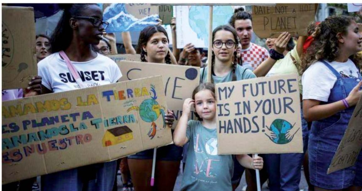
Manifestación de estudiantes contra el cambio climático en Barcelona.

Sin embargo, las personas tenemos el futuro del planeta en nuestras manos. Cada una de nosotras, desde su realidad cotidiana, puede incidir en avanzar hacia la consecución de la Agenda 2030 de Desarrollo Sostenible, una agenda para responder a los retos globales.