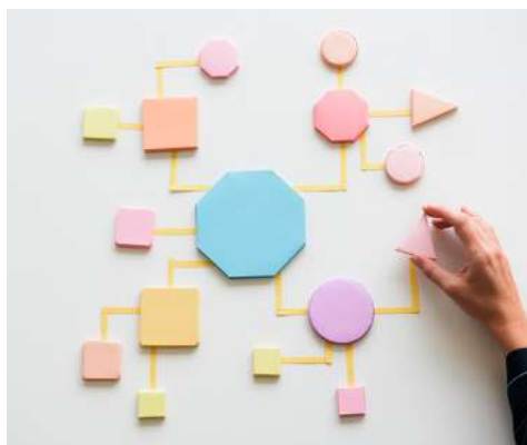
Figura 4. Mapeo

Objetivo general: disponer de un registro vivo de actores/as, clasificados por poder e interés, con estrategias concretas para involucrarlos en el POA y el seguimiento.