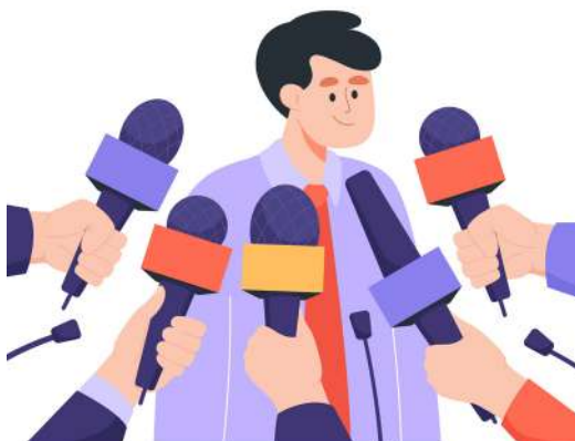
Figura 2. Entrevistas