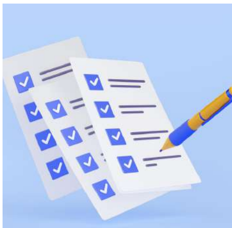
Figura 5. Herramientas de monitoreo

La matriz ORI (Objetivos–Resultados–Indicadores) ayuda a dar coherencia al seguimiento. Permite vincular cada objetivo estratégico con resultados concretos, indicadores claros y fuentes de verificación. Al aplicar esta herramienta, los equipos distritales pueden responder: ¿qué queremos lograr? ¿cómo sabremos si avanzamos? ¿qué evidencia lo mostrará?