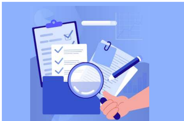
Figura 1. Diagnóstico