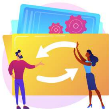
Figura 5. Retroalimentación