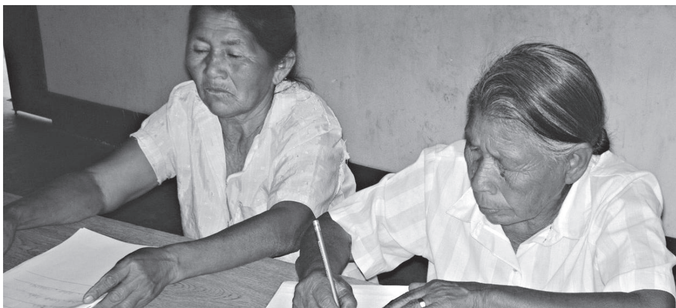
Alfabetización de mujeres adultas guaraníes. Bolivia

Fundación Intercultural Nor-Sud (Bolivia)