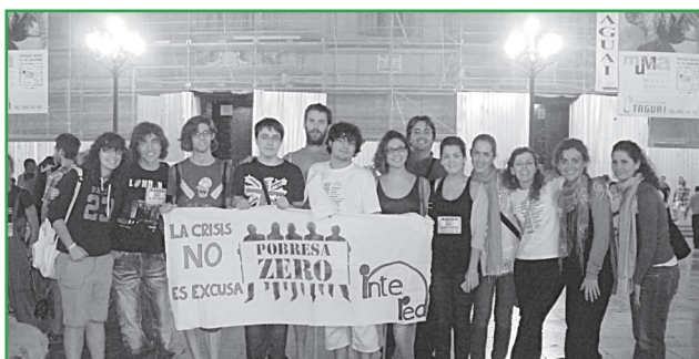
Manifestación en Valencia. InteRed Comunidad Valenciana.