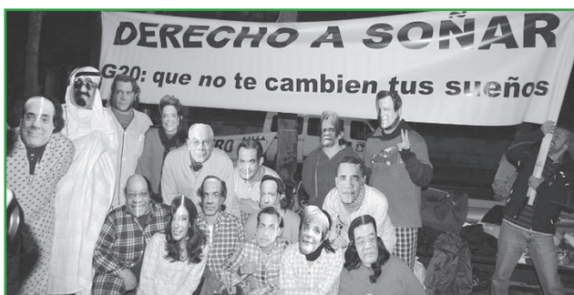
Performance de movilización en Zaragoza. InteRed Aragón.