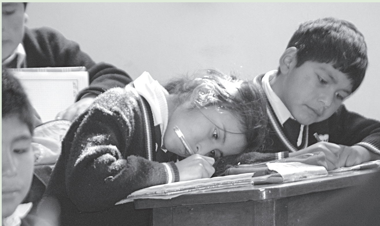
Escolares en el aula. Cochabamba (Bolivia)

Existen patrones socioculturales y formas de pensar que transmiten roles que acentúan la desigualdad entre hombres y mujeres. La coeducación, juega un papel transcendental en el aprendizaje de modelos al proponer que todas las personas sean formadas en un sistema de valores, comportamientos y normas que no esté jerarquizado en función del sexo.