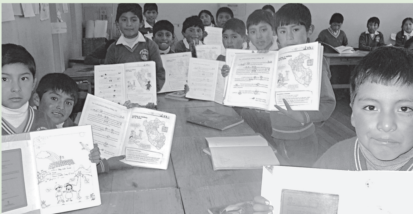
Niñas y niños en la escuela de zonas rurales. Puno (Perú)

Cabe mencionar que, a pesar de que el género masculino es el privilegiado en nuestra sociedad, no quiere decir que los estereotipos ofrecidos les ayuden a lograr su pleno desarrollo. Por el contrario, ser del