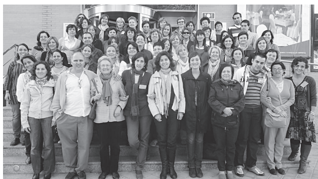
Participantes de la Red de Centros Educativos.

Los días 21 a 23 de octubre pasado, tuvo lugar en Fuenlabrada (Madrid) el I Encuentro de la Red de Centros de Educación para el Desarrollo y la Ciudadanía Global (EpDCG), promovida por InteRed, para concretar la propuesta socio-educativa para la transformación social con enfoque de género y de derechos humanos.