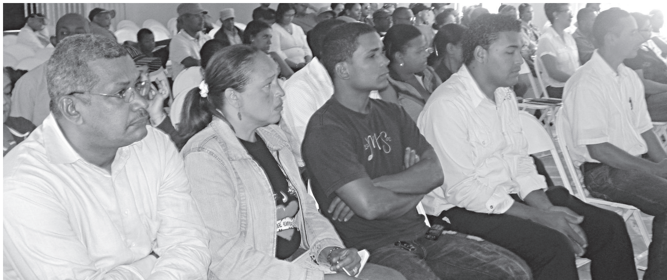
Sesión formativa en valores democráticos.

En cada municipio se ha puesto en marcha, en el marco de los proyectos aprobados de acuerdo con el presupuesto participativo, una comisión de seguimiento, formada por personas capacitadas, para la vigilancia de las obras comunitarias al efecto, que finalizado el proyecto, tengan capacidad de dar seguimiento ellas mismas, instalando así, todo un sistema de trabajo de relación entre instituciones y organizaciones civiles para el bien de la comunidad.