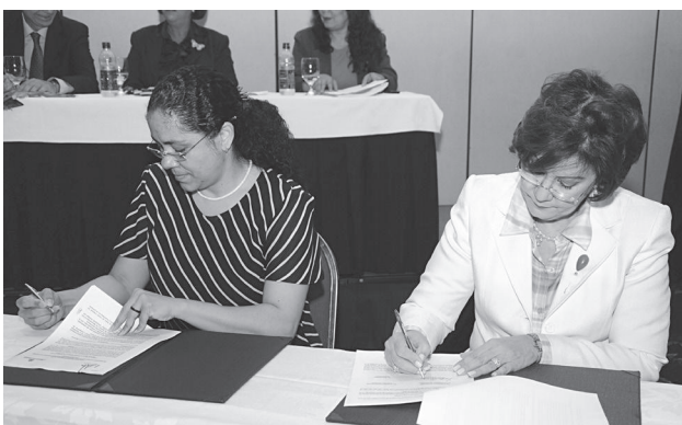
La Ministra de Educación de República Dominicana, Josefina Pimentel (a la derecha) y Rita Ceballos, en la firma del convenio.

El programa se propone, además de la formación en competencias lectoras, escritas y matemáticas, el