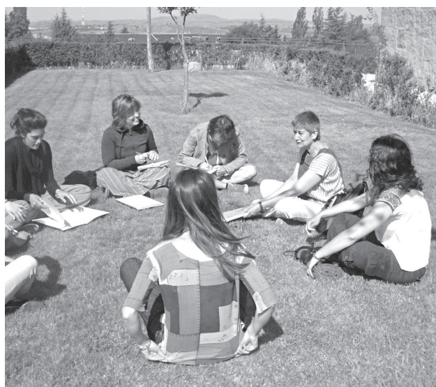
Curso de formación de voluntariado.

Desde hace 16 años InteRed realiza el Curso Taller de Formación para voluntariado que está enmarcado en un Programa de Voluntariado Internacional más amplio, con el objetivo de sensibilizar acerca de la realidad de exclusión de los países de América Latina, África y Asia con los que trabajamos desde la organización así como la interdependencia global de los países en torno a las causas de esta pobreza y desigualdad. Y así, desde una metodología que propicia la participación, el diálogo y la implicación se persigue fomentar la reflexión crítica y motivar para el compromiso y la participación solidaria.