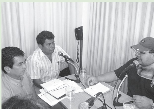
El presidente del distrito 5 de Cochabamba y el presidente de padres y madres en la radio comunitaria.

El Centro de Educación Permanente Jaihuayco (CEPJA) e InteRed, con el apoyo de la Junta de Comunidades de Castilla La Mancha, trabajan en la promoción de los derechos de niñas, niños, adolescentes y adultos, orientado a la formación de líderes comprometidos con la construcción de una sociedad más democrática, en el marco del Proyecto: "Potenciar la formación integral, la promoción de líderes y el establecimiento de redes con las instituciones comunitarias para la mejora del barrio y la transformación social de la comunidad de la zona sur de Cochabamba" .