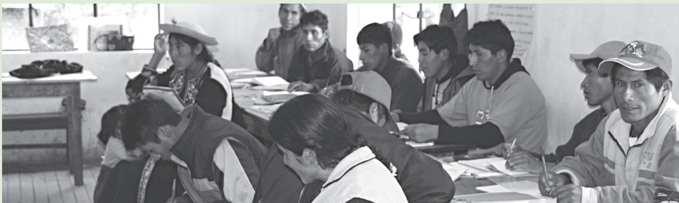
Alfabetización de personas adultas en zonas rurales. Titicachi (Bolivia)

El Convenio de InteRed con la Agencia Española de Cooperación Internacional para el Desarrollo (AECID): “Educación básica gratuita, de calidad e inclusiva para niños, niñas, jóvenes y adultos, especialmente niñas y mujeres indígenas y de zonas rurales, de Bolivia” ha iniciado su ejecución en agosto del 2010, tras un proceso de fase de identificación participativa con las 5 organizaciones socias en terreno (Centro de Multiservicios Educativos – CEMSE, Centro de Educación Permanente Jaihuayco – CEPJA, Fundación Intercultural Nor Sud, Centro de Educación Alternativa Idelfonso de las Muñecas y el Centro Yachay Tinkuy).