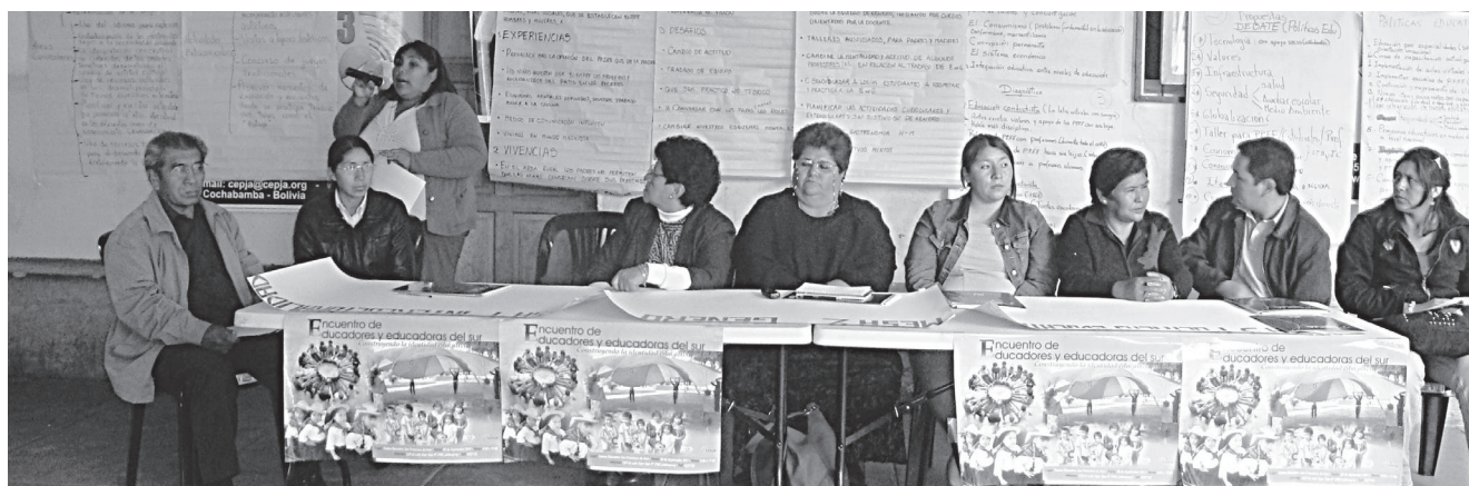
Encuentro con profesorado de la zona sur, Cochabamba, Bolivia.

parte de la población del sur. Los dirigentes son parte de las decisiones que se toman a nivel local, trabajamos con ellos para que en sus decisiones tomen en cuenta la dimensión educativa y su preocupación no sólo se reduzca al mejoramiento de calles y avenidas.