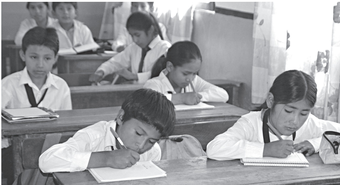
Escolares en Cochabamba (Bolivia).

género masculino implica, en general, renunciar a la sensibilidad para mantener la dureza de carácter, mantener una constante actitud de competencia con alta carga de agresividad, estar siempre en guardia para defenderse frente a los demás.