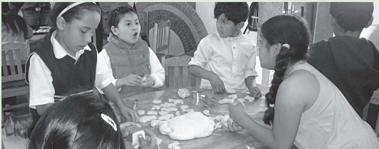
Niñas y niños haciendo masitas como forma de trabajar la equidad de género.