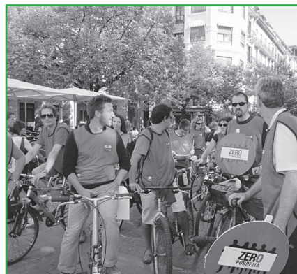
Bicimartxa en Donosti. InteRed Euskal Herria – País Vasco.