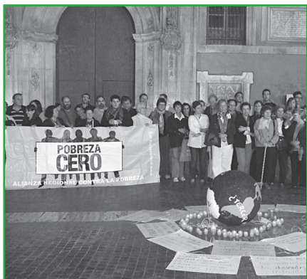
Concentración en la plaza de la catedral de Murcia. InteRed Murcia.

Organizada por la Alianza Española contra la Pobreza y en un contexto en el que la crisis está teniendo gravísimas consecuencias para las personas más vulnerables, delegaciones de InteRed de las diferentes Comunidades Autónomas se sumaron a las movilizaciones organizadas por la coordinadora estatal y las coordinadoras autonómicas. Entre 55 y 90 millones de personas viven en condiciones de extrema pobreza, el 70% son mujeres y existe el riesgo de que, para 2015, al menos 29 millones de niños y niñas sigan sin escolarizar.