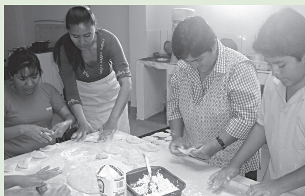
Participantes en formación de repostería para ser microempresarios.

También trabajamos el derecho a la participación con otros actores sociales que son los dirigentes de las organizaciones territoriales de base, ellos son los aliados estratégicos para que las acciones educativas de la zona tengan mayor incidencia y favorezca a mayor