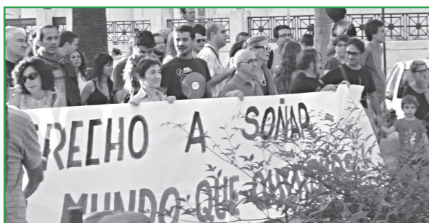
Movilización en Málaga. InteRed Andalucía.