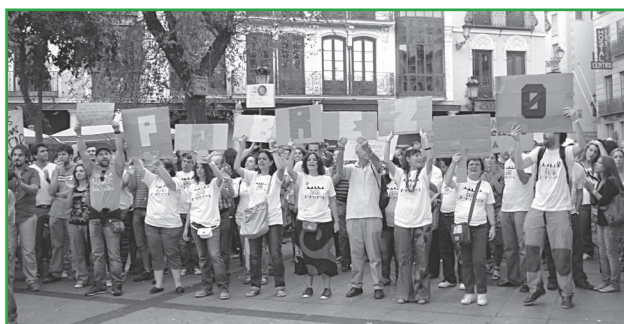
Movilización en Toledo. InteRed Castilla La Mancha.