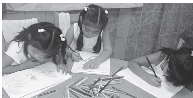
Niñas de 4 a 6 años en el Centro de Educación Permanente Jaihuayco

Otra acción que realiza el Cepja para potenciar los procesos de formación de líderes e impulsar la capacidad