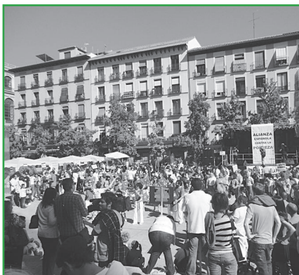
Concentración en Madrid. InteRed Madrid.