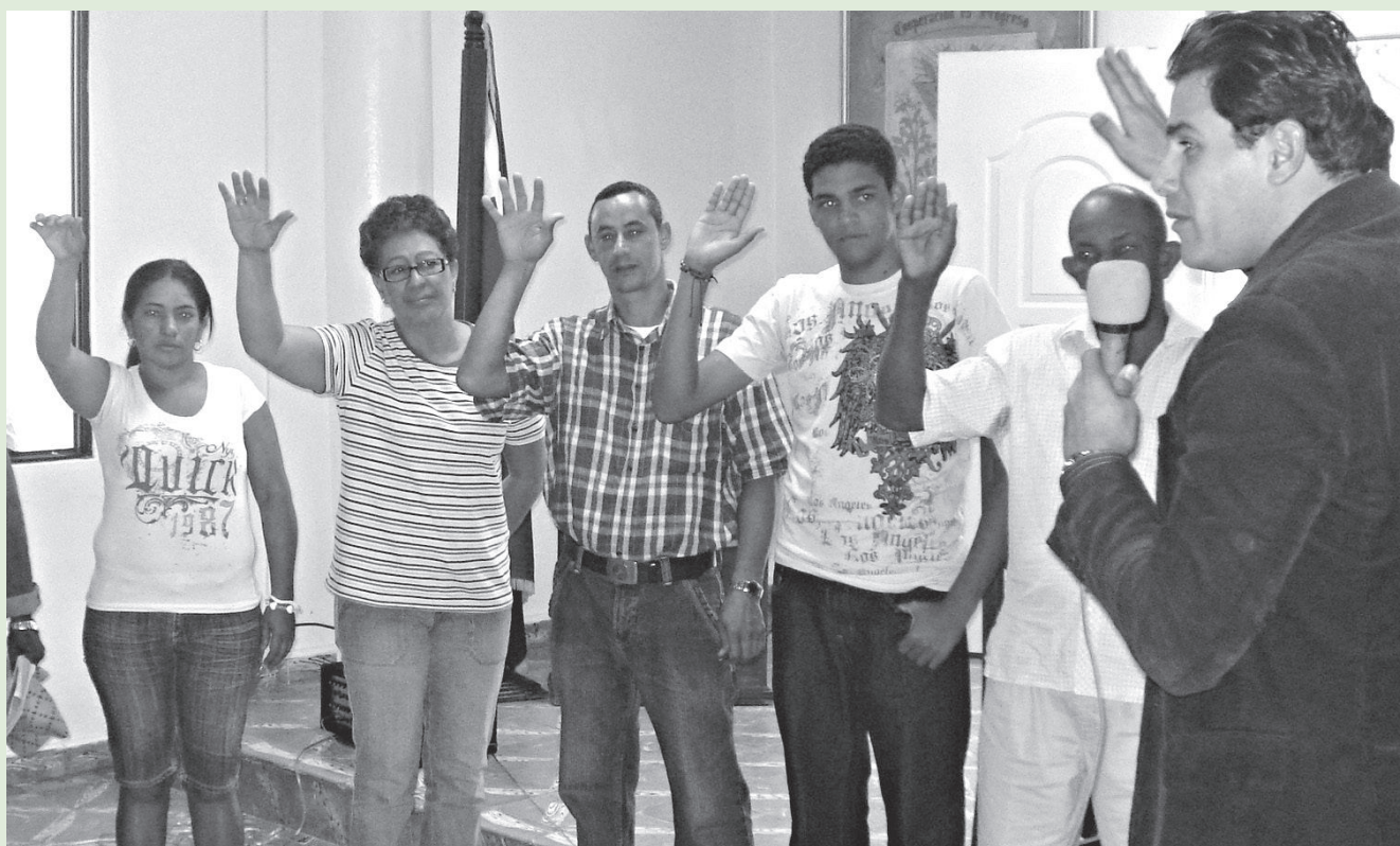
Formación de ciudadanos y ciudadanas en participación ciudadana.

El Gobierno de Aragón colabora con InteRed en el proceso de participación de la ciudadanía en el centro sur de República Dominicana