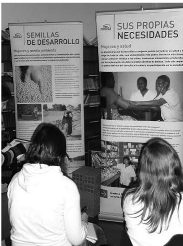
Alumnos trabajando sobre la Campaña de InteRed en Barcelona.