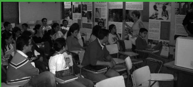
IES Almudéyne

El Instituto de Secundaria y Bachillerato Almudéyne se volcó en la semana del 23 al 27 de octubre con la campaña. Más de 10 profesores/as y alrededor de 300 alumnos/as han participado en las actividades con una muy buena acogida.