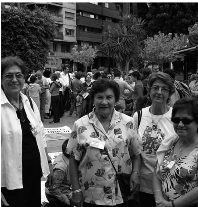
Actividades Campaña Pobreza Cero en Cartagena.

Tienen lugar del 23 al 28 de octubre. InteRed participa en la preparación y desarrollo de las mismas junto con las otras ONGDs presentes en la ciudad, todo ello desde el Consejo de Cooperación del Ayuntamiento. Se pretende sensibilizar a la ciudadanía y dar a conocer estas organizaciones.