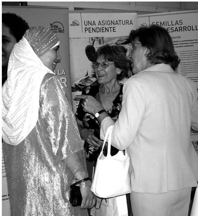
I Jornadas Cartagena Solidaria.

En el marco de las I Jornadas "Cartagena Solidaria", y a partir del 30 de octubre y hasta el 27 de noviembre, la exposición estuvo recorriendo tres centros educativos con niveles de primaria y secundaria; la asociación de mujeres "Amanecer" y un centro cultural, establecimientos situados en diversos barrios de la ciudad. En todos ellos se realizó una presentación de InteRed y una motivación sobre la campaña.