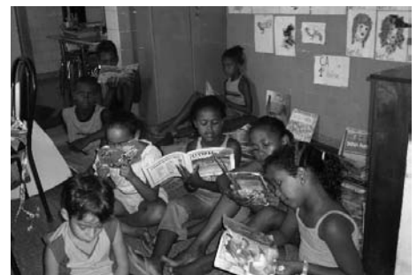
Festival de lectura en Sapucaia