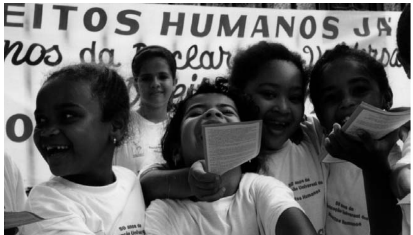
Niños participando en actividades de Novamerica.

Sin embargo, el propio Ministerio de Educación desconoce los datos exactos acerca de cuántas personas han sido escolarizadas desde que comenzó el programa Brasil Alfabetizado , que ha sido apoyado por varias ONG's. Pero según un informe del PNAD (Investigación Nacional por Muestras de Domicilio), si en 2003 el número de analfabetos en Brasil mayores de quince años era de 11,54%, dos años después, la cantidad registrada era de 11,05%, un dato que aunque parece más