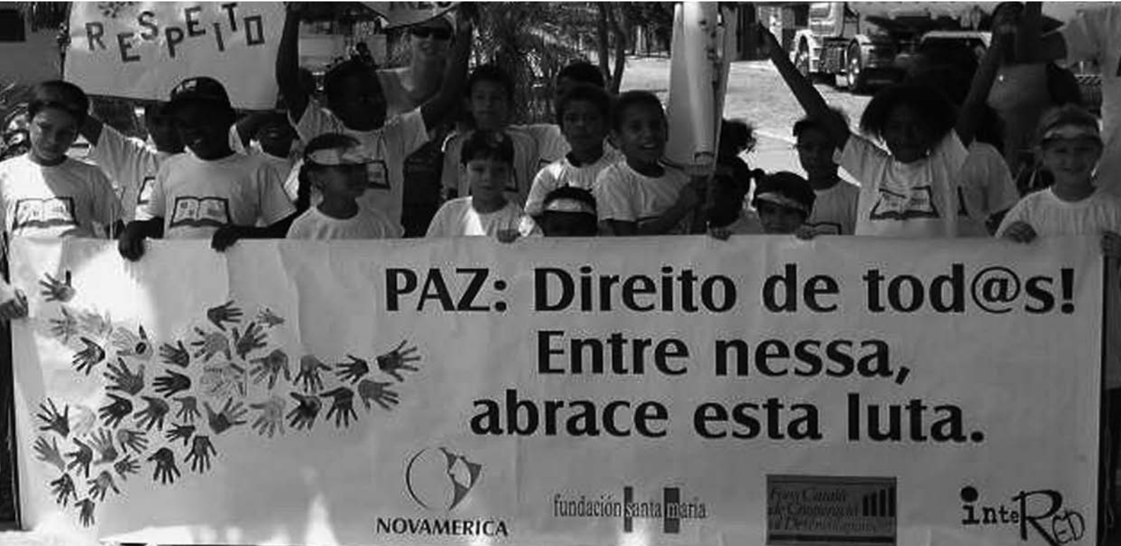
Caminata por la paz.