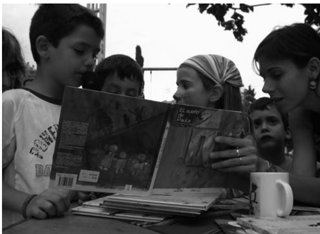
Lectura del cuento de la campaña por niños del barrio del Congrés. Barcelona

El 10 de octubre Niños y niñas del barrio del Congrés participaron en la lectura del Cuento de la Campaña 2006-2007. Este evento sirvió para sensibilizar e informar sobre los objetivos de la campaña y acercar a los más pequeños al tema de género desde la fantasía y la reflexión.