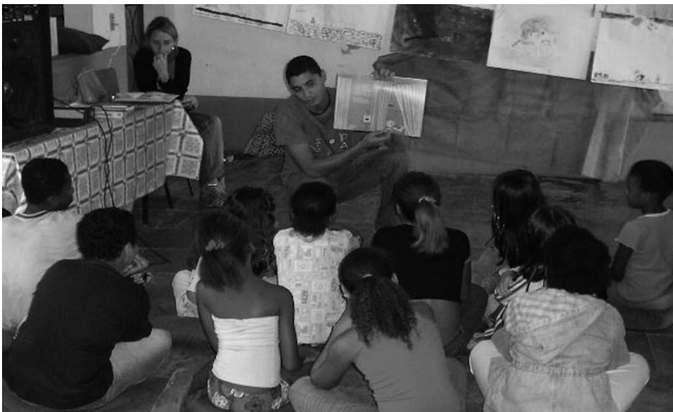
Biblioteca Popular en Sapucaia

En definitiva, las dos organizaciones, InteRed y Novamérica , se han propuesto paliar con sus ideas y esfuerzos los problemas que amenazan los derechos de millones de brasileños. Es indispensable marcar primero el terreno y señalar cuáles son las dificultades que impiden el desarrollo de la sociedad en su conjunto, esto es, la falta de acceso a la información, la discriminación racial y de género, el fracaso escolar de los niños, la violencia y los múltiples casos de exclusión social. Una vez que estos problemas son detectados, es preciso "contraatacar" con dosis de formación en Derechos Humanos, para propiciar primero la conciencia de grupo, más tarde, el empoderamiento de los propios sujetos sociales, la participación e implicación en los cambios, así como el intercambio de experiencias y conocimientos entre los protagonistas de esta historia, porque otro Brasil es posible, sí.