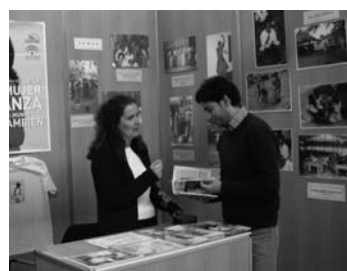
Día Internacional del Voluntariado en Jaén