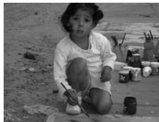
Proyecto Fundación Del Viso, Ciudad Educativa (Argentina).

Por ello durante el próximo cuatrienio la organización apostará por ampliar la base social de la organización que permita asumir el crecimiento experimentado, optimizar la calidad y, en su caso, incrementar la cantidad de sus acciones. A través de la modificación de la estructura organizativa actual, se tenderá a mejorar los mecanismos de coordinación y de comunicación interna entre los distintos órganos de InteRed, garantizando la identidad y la unidad de acción de InteRed como organización única pero profundizando en la aplicación de los criterios de descentralización y delegación.