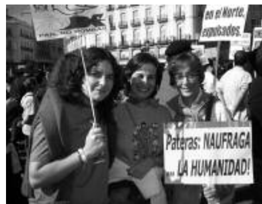
Manifestación Pobreza Cero en Madrid.