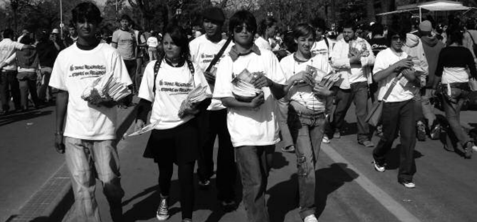
Jóvenes de Buenos Aires (Argentina) repartiendo materiales de sensibilización sobre los Derechos del Niño y la Niña.