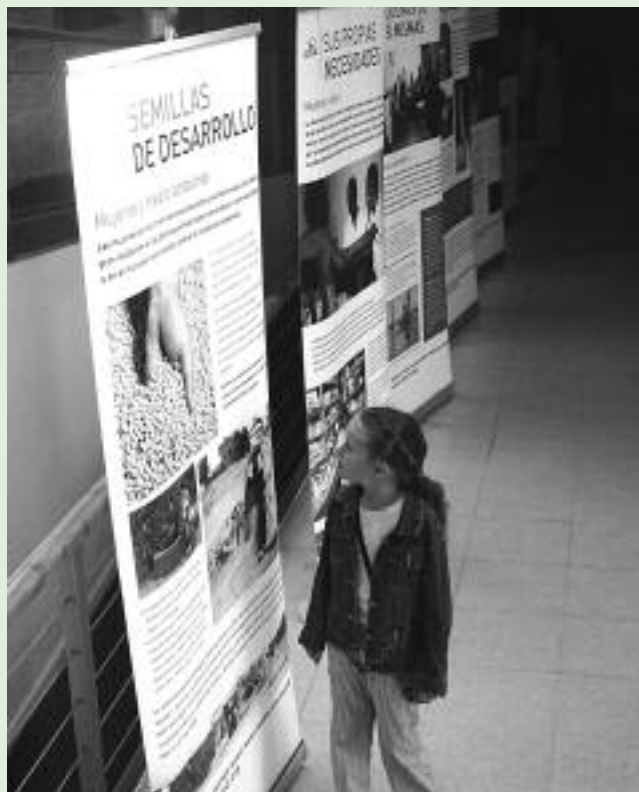
Exposición fotográfica en Horche (Toledo).

Hace ya casi diez años las ONGD españolas, aglutinadas en la Coordinadora Estatal, creyeron necesario reflexionar sobre el papel que debían desempeñar en la cooperación al desarrollo y consensuar algunos principios mínimos de actuación. Dada la multiplicidad de organizaciones e intereses, reflejo del pluralismo de la sociedad, era necesario establecer un marco de autoregulación ético del sector. Fruto de esta reflexión fue el Código de Conducta de las ONG de Desarrollo, que ha sido suscrito por todas las integradas en la Coordinadora estatal y en las 15 coordinadoras autonómicas.