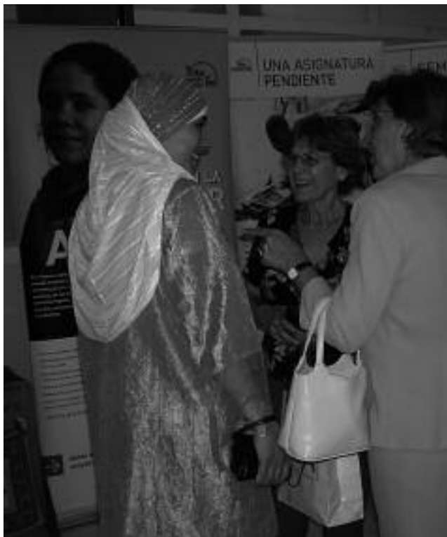
Exposición fotográfica en Cartagena.

Las líneas de trabajo, a desarrollar en las acciones que se lleven a cabo, se centrarán en las actuales: Educación, capacitación y formación básica; género y desarrollo; gobernabilidad, ciudadanía y fortalecimiento de organizaciones; y derechos de la infancia , pero también se iniciará un periodo de reflexión para determinar la pertinencia de introducir otras nuevas como "Cultura y Desarrollo" y "Codesarrollo" . Todas estas líneas de trabajo tendrán como criterio común de intervención el apoyo a procesos socio-educativos, incluyendo la formación/capacitación de RRHH.