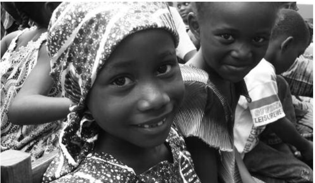
Niñas en el colegio Virgen María de África (Malabo).

Parte de las actividades propuestas implican trabajo directo con funcionarios del estado para poder crear una base que facilite el trabajo sobre la violencia. La intervención prevé un apoyo directo para formación de actores relacionados con sistemas de apoyo a las víctimas de violencia, pero por lo general, la coordinación también servirá para aclarar el papel estatal y de la sociedad civil y facilitar que la intervención prosiga su trabajo allí.