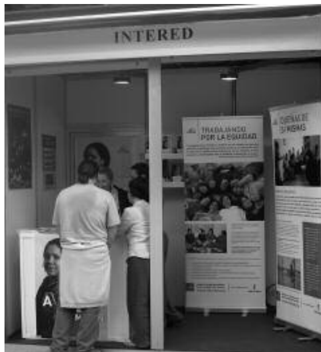
Stand de InteRed Castilla-La Mancha.

Con el fin de plasmar en la práctica la Misión, los Valores Compartidos y la Visión, en la implementación del presente Plan Estratégico II, la organización buscará promover la adhesión de los miembros de InteRed desarrollando una estrategia de comunicación externa para difundir la Misión, los Valores Compartidos, la Visión y el contenido y realización del propio Plan Estratégico.