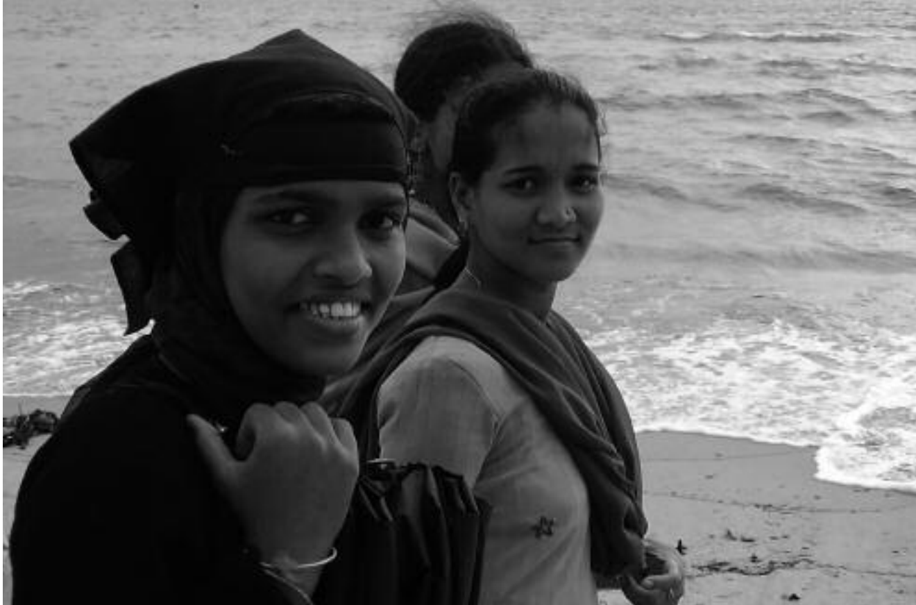
Jóvenes en Honnavar (India).

apreciable el esfuerzo realizado por la Dirección General de Planificación y Evaluación de Políticas de Desarrollo en el diseño de estrategias sectoriales de cooperación que doten de contenido y continuidad nuestra cooperación internacional y que nos ayude a priorizar nuestras acciones alineándolas con los compromisos internacionales y en la aplicación de herramientas que permitan una mejor coordinación, planificación y evaluación de la cooperación española. Está avanzada la reforma de la AEI, en el marco de la nueva Ley de Agencias Estatales, para adaptarla a unos niveles de ayuda cuantitativa y cualitativamente superiores que probablemente verá la luz antes de marzo de 2008.