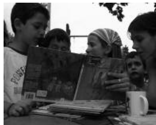
Lectura cuento El sueño de Paula en Barcelona.

Mujeres cruzando la frontera entre R. Dominicana y Haití.