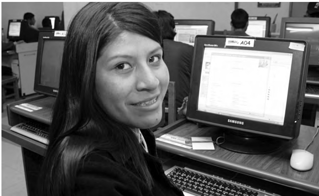
Formación en informática en el CEMSE - Bolivia.

“La necesidad de implicar a nuestros gobiernos para que asuman su responsabilidad en el cumplimiento de los acuerdos firmados, promover la igualdad en todos los ámbitos, garantizar el ejercicio de los dere-