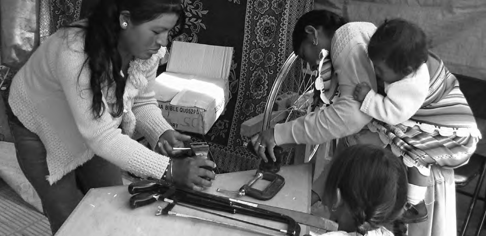
Mujeres bolivianas.