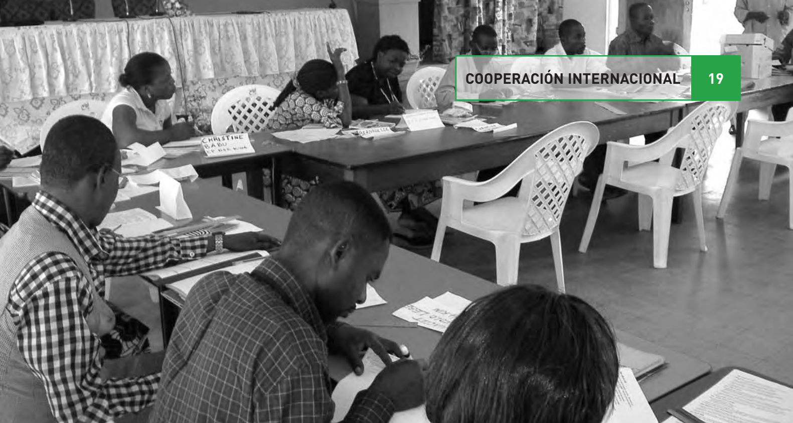
Sesión de formación de calidad de la enseñanza dirigida a maestros y maestras de primaria y secundaria.

construcción de escuelas y formación de las maestras y maestros, porque rehabilitar los edificios escolares, desatendiendo el gran problema de la calidad de la enseñanza, sólo renovarían el entorno de los alumnos sin mejorar la enseñanza misma.