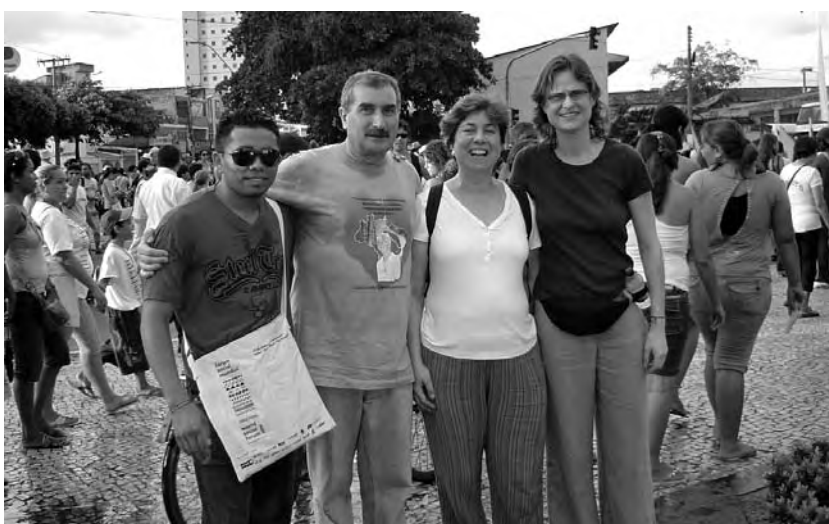
La autora del artículo (segunda por la derecha) con otros participantes del Foro Social Mundial.