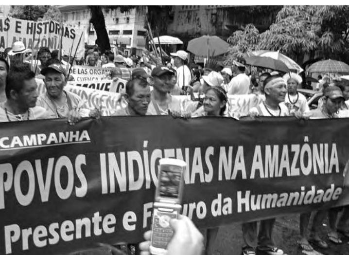
Marcha por los derechos de los pueblos indígenas.

Este año todas las actividades del Foro han girado entorno a diez objetivos con ciertas líneas convergentes: un mundo de paz, justicia y ética; los derechos de los pueblos y las personas; la participación de los hombres y las mujeres en las decisiones que les incumben; y la defensa del medio ambiente como fuente de vida.