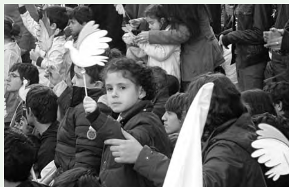
Marcha por la paz.

Nos manifestamos por la paz. Bailamos por la paz