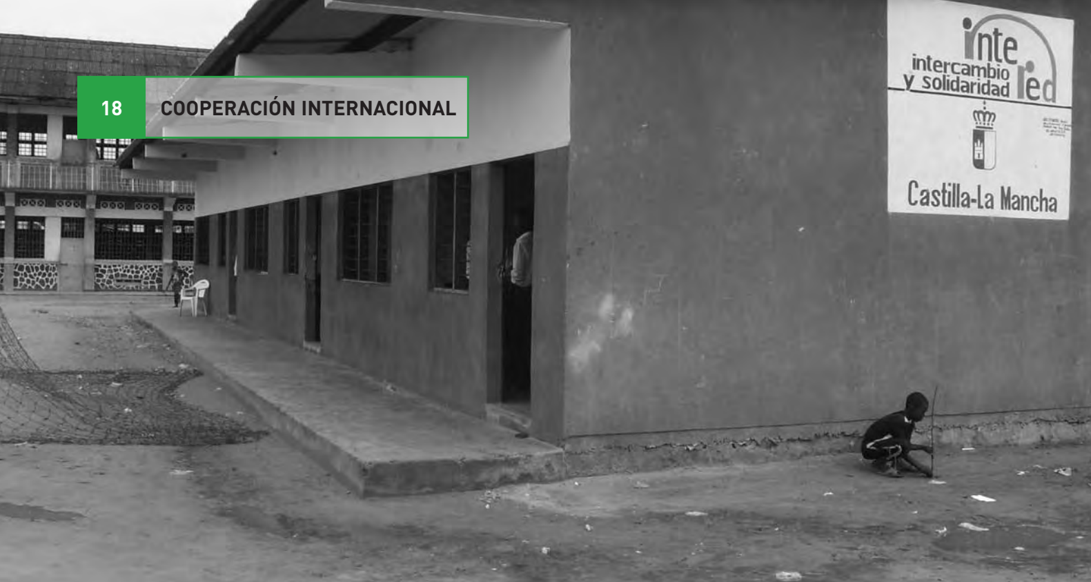
Escuela reformada en uno de los barrios marginales de Kinshasa