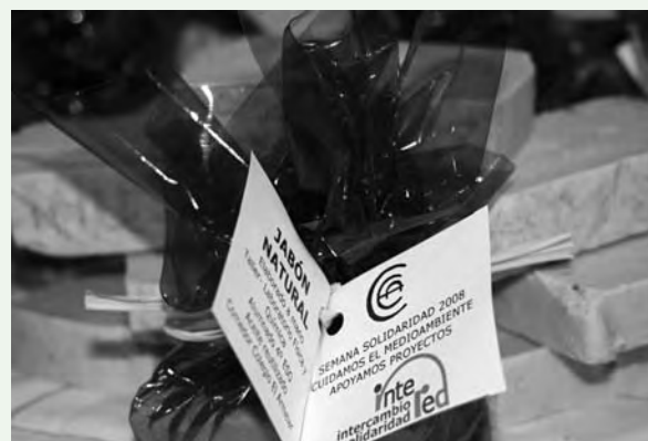
Jabón InteRed, todo tan verde como el color verde de InteRed.

"Adhesión circunstancial a la causa o a la empresa de otros". Esta es la definición del diccionario de la Real Academia Española del término "solidaridad". Si la extrapolamos a nuestro mundo observamos que las personas en su mayoría nos llamamos solidarios porque recordamos a los necesitados en fechas concretas, lo que hace desvirtuar, a mi modo de ver, el significado del término real.