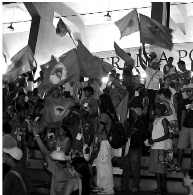
Público participante en las actuaciones organizadas por el Foro Social Mundial.

Además de ser una especie de escaparate de experiencias, músicas y culturas, ha sido un espacio importante para la formulación de alianzas que fortalecen los procesos ya iniciados y posibilitan iniciar otros nuevos. De hecho, sólo el ver a tantas organizaciones con personas comprometidas en buscar una vida orientada por otros valores anima