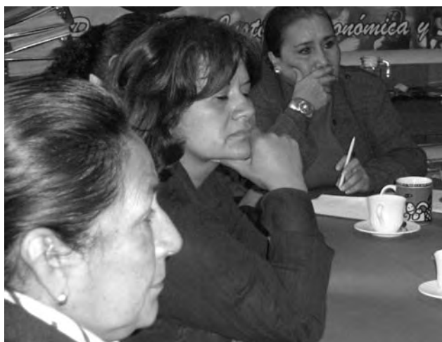
Formación en capacitación de liderazgos. La autora del artículo con el lápiz en la mano.

Para atender los problemas que impiden el ejercicio de sus derechos y liderazgos, CEDAL, junto con las mujeres líderes de doce regiones del país, hizo un diagnóstico y, después del análisis de la realidad de cada una de ellas, desarrollaron el “árbol de los problemas” y las relaciones de causa-efecto que los unen y, el “árbol de los objetivos”, que ilustró las relaciones entre los medios disponibles y los propósitos establecidos.