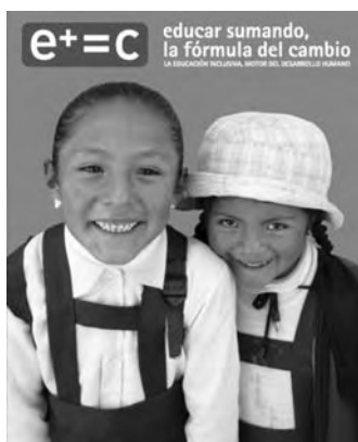
Cartel de la campaña

Bajo el título, “Educar sumando, la fórmula del cambio”, InteRed presenta por diferentes Comunidades Autónomas, una campaña que tiene como objetivo sensibilizar a la sociedad española sobre la importancia de que todas las personas, más allá de sus particularidades, tengan las mismas oportu-