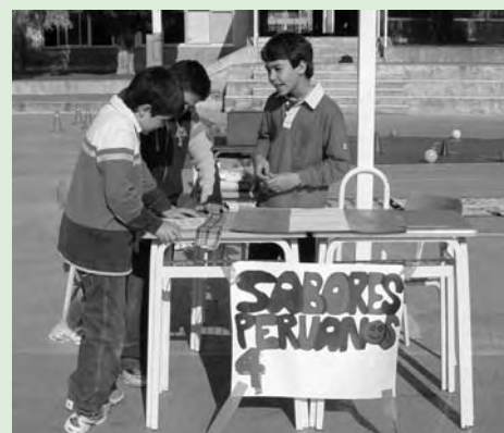
Feria de la solidaridad.

La implicación y compromiso del profesorado, alumnado, personal no docente y familias ha hecho posible que se recaudaran 6.500 euros para apoyar proyectos solidarios de InteRed, se han llevado a cabo muchas iniciativas y se han celebrado experiencias significativas: