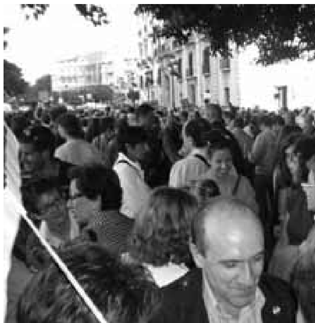
Manifestación en Valencia.