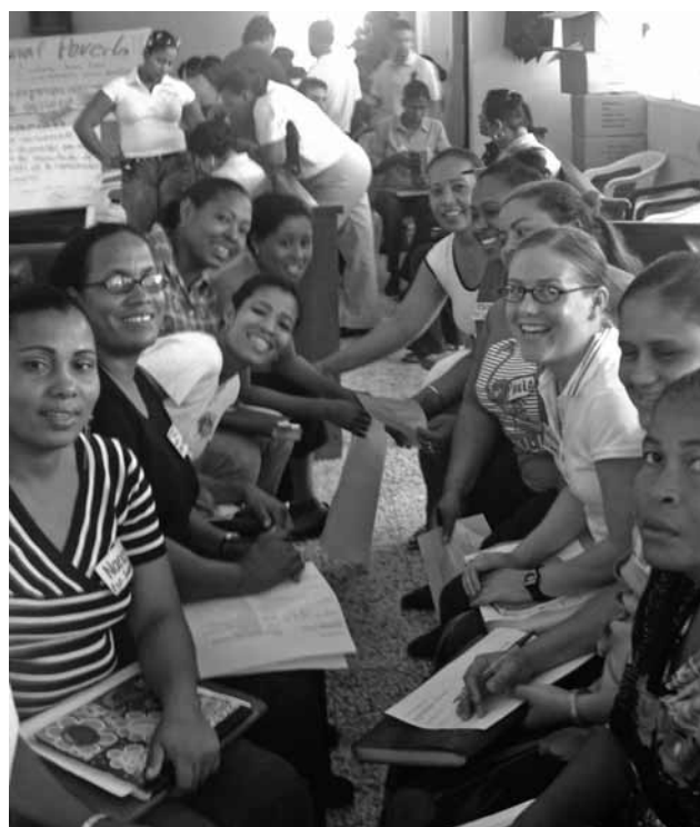
Todas las fotografías son de distintos momentos de formación del profesorado en República Dominicana.

En las 11 escuelas de Cévicos se capacitan 80 maestras y maestros para desarrollar las competencias de