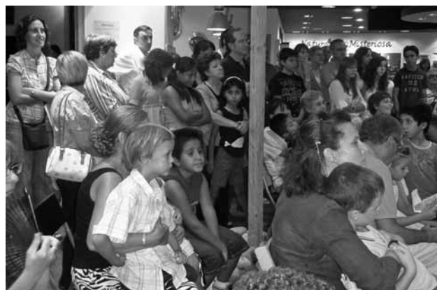
Presentación de los cuentos en Madrid

"¡Feliz cumpleaños, amiga liebre!", es un teatro infantil kamishibai, ilustrado por Toni Amago, destinado a los niños y niñas más pequeños que destaca valores como la amistad, la colaboración y la diversidad. El Kamishibai es una forma de contar historias de tradición japonesa que consiste en un escenario de cartón o madera en el que se van cambiando las ilustraciones a medida que se va sucediendo el relato.