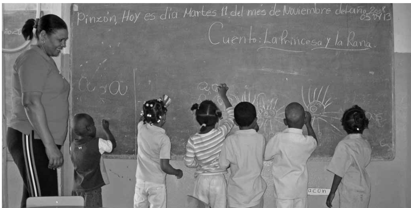
Alumnado en Elías Piña. República Dominicana.

En América Latina y el Caribe las razones que explican la falta de inclusión de sus sistemas educativos, hunden sus raíces en la misma estructura social, profundamente excluyente, cuando menos desde la época colonial. Con excepción de algunas repúblicas del cono sur, el conjunto de la región ha discriminado secularmente a determinados grupos sociales: las mujeres, las poblaciones indígenas, las personas con capacidades diferentes, las personas mayores, y, en general, aquella población que sobrevive en las áreas rurales y más empobrecidas del continente.