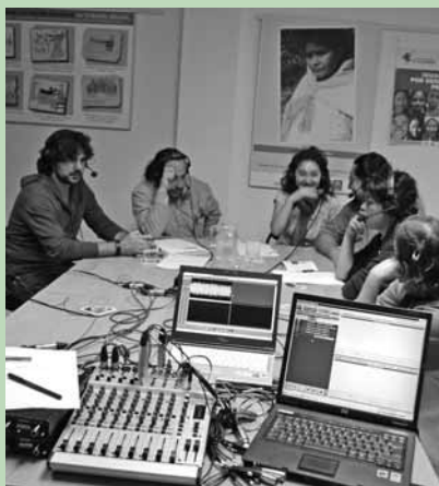
Un equipo de Radio Nacional de España se desplazó a la sede de InteRed en Madrid y montó un estudio para tratar de forma monográfica la Red en el espacio "Solidarios".