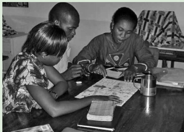
Profesorado desarrollando actividades de formación.

La educación es la condición esencial para que la población pueda tener acceso al mundo laboral, iniciar un trabajo profesional que contribuya a su desarrollo como personas ciudadanas y que sean responsables en su sociedad, capaces de contribuir activamente en la mejora de la misma. Sin educación, no avanzamos. La formación del profesorado es esencial para garantizar una educación de calidad a