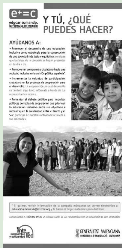
Panel que conforma la exposición de la campaña.

Desde el pasado mes de febrero, la Campaña se ha lanzado en catorce ciudades ( Sevilla, Málaga, Jaén, Cór-