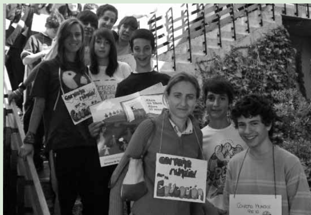
Preparados para salir a la calle por la Educación.