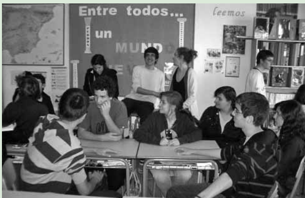
Preparación, con varios centros educativos, de la Semana de Acción Mundial por la Educación.

Equipo de Pastoral y Proyectos Sociales Academia Santa Teresa-Málaga