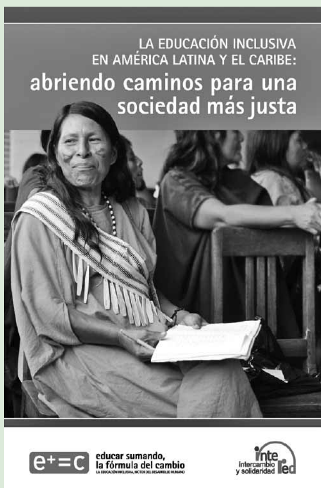
Portada de la investigación, cuyo autor es Alejandro Fernández.

InteRed pone todo su empeño en modificar las desigualdades en materia de educación de los grupos menos favorecidos: las comunidades más pobres, los niños y niñas que viven en la calle, la infancia que trabaja en zonas remotas y rurales, las comunidades desplazadas, los pueblos indígenas, las personas mayores. Tenemos que promover, desde la sociedad civil española, un compromiso ciudadano para que esa hermosa palabra, Educación , sea una realidad para todas las personas que vivimos en el planeta.