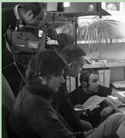
Un equipo del programa de TVE, "Babel", se trasladó a la sede de InteRed.