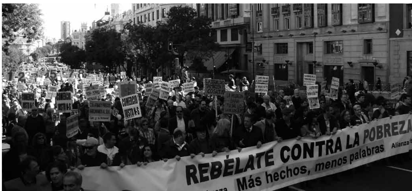
Movilización en Madrid

Miles de personas se han sumado a las movilizaciones, convocadas por la “Alianza Española contra la Pobreza”, en más de 60 localidades. InteRed participó en las diferentes ciudades donde están implantadas sus delegaciones. Como ejemplo de ello os traemos las concentraciones de Madrid y Cantabria.