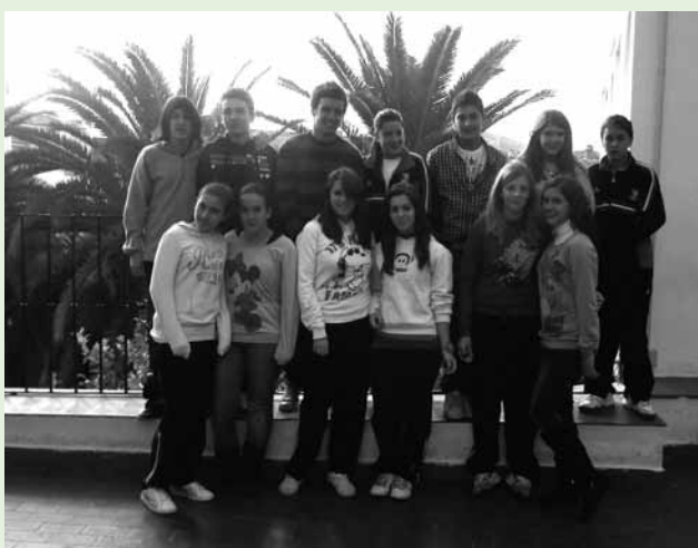
Jóvenes emprendedores solidarios del Colegio Pedro Poveda de Jaén.

El profesorado y alumnado del Colegio Pedro Poveda de Jaén apoya dos iniciativas solidarias en el marco de InteRed: el proyecto de Jóvenes Emprendedores Solidarios con la Asociación de Alumnos y Alumnas "Los Patios" e InteRed Joven: