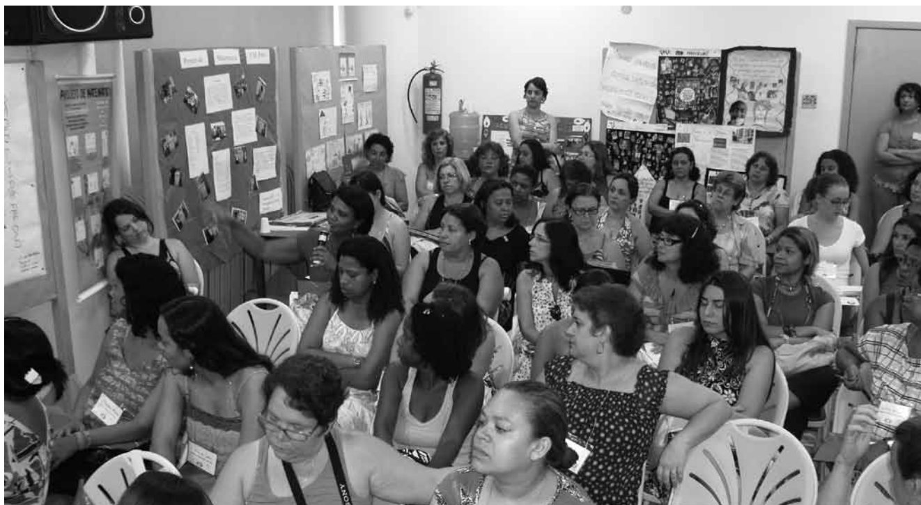
Encuentro de profesorado en el estado de Río de Janeiro.

(MEDH) ha sido una gran estrategia pedagógica para fortalecer esa identidad, reuniendo a educadores y educadoras que tratan de contribuir a que la cultura escolar y la cultura de la escuela tengan los Derechos Humanos como referencia esencial.