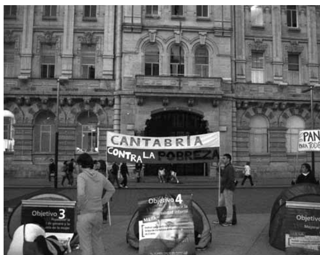
Acampada “Contra la Pobreza” frente al Ayuntamiento de Santander.

En Cantabria , las movilizaciones han tenido lugar en Santander, Torrelavega y Laredo, entre otras ciudades. InteRed Cantabria ha participado activamente en actividades de calle como el “Yo Recorto” , donde los ciudadanos y ciudadanas pudieron opinar sobre los recortes sociales y ofrecer alternativas; en la acampada simbólica en contra de la pobreza frente al Ayuntamiento de Santander y en la manifestación que tuvo lugar por el centro de la ciudad.