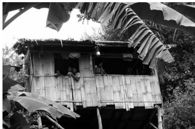
Barangay, casa rural filipina donde habitan las familias.

Uno de los principales problemas de estas comunidades, que se dedican casi al 100% a la agricultura, es el bajo nivel de ingreso familiar debido, principalmente, a la limitada productividad de las granjas agrícolas, entendido desde la falta de conocimientos de los agricultores y agricultoras para mejorar sus cosechas, así como la comercialización de los productos agrícolas a intermediarios que monopolizan el mercado. A través del proyecto, se ha logrado formar a las mujeres y hombres campesinos en técnicas de agricultura sostenible que permitan mejorar la calidad de las cosechas, teniendo en cuenta el equilibrio ecológico de los recursos naturales. Los productos agrícolas se han comercializado a través de cooperativas agrícolas que han permitido abrir canales de comercialización. Para ello, se ha formado a líderes campesinos y campesinas en conceptos básicos de gestión de cooperativas que les permita sostener sus actividades.