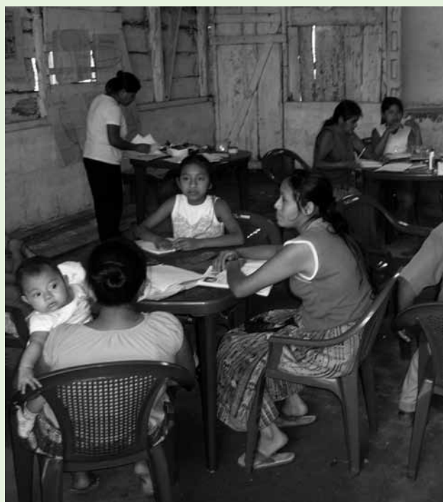
Centro de alfabetización en Guatemala.

A pesar de que la alfabetización de personas jóvenes y adultas no suele ser una cuestión central en la agenda política y de los grandes medios de comunicación, hay que resaltar que su importancia es esencial para las organizaciones que trabajamos por los derechos de las mujeres, ya que no se trata sólo de “aprender a leer y escribir”, sino