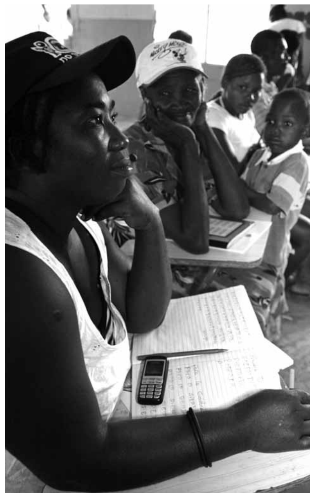
Centro de alfabetización en San José de los Llanos. República Dominicana.

Desde 2008 trabajamos en este Convenio Regional en el cumplimiento del derecho a la educación de calidad y sin discriminación con 41 grupos de alfabetización de personas jóvenes y adultas acompañados por tres organizaciones socias de InteRed en República Dominicana: el Centro de Planificación y Acción Ecuménica (CEPAE), la Confederación Nacional de Mujeres del Campo (CONAMUCA) y la Sociedad Cultural Almirante Colón (SCAC), con la asesoría pedagógica del Centro Cultural Poveda.