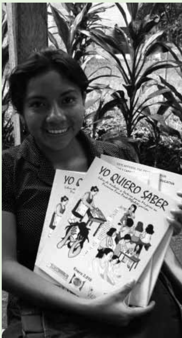
Una promotora de alfabetización en Guatemala con el cuadernillo "Yo quiero saber".

El analfabetismo a nivel mundial está alrededor de los 759 millones de personas, 44 millones de ellas en América Latina. Las estadísticas indican que del total de analfabetas, el 64% son mujeres. Pero cuando ponemos la mirada en la mujer guatemalteca, rural e indígena, resulta que esta tasa debido a la exclusión sistémica, es mayor, un 69.9%.