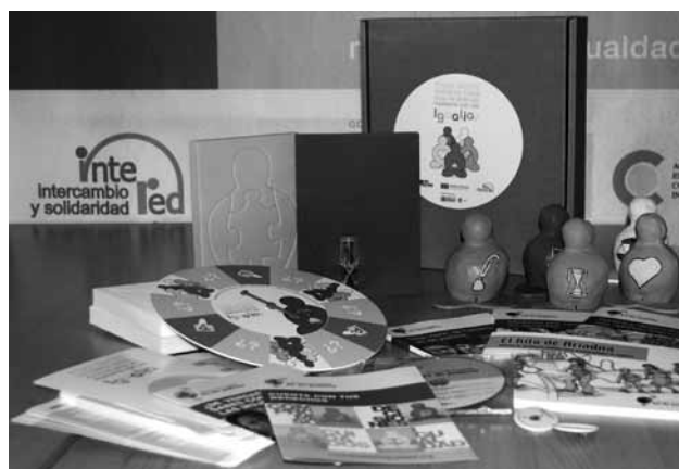
Materiales de la Campaña Muévete por la Igualdad

Con el fin de fortalecer las capacidades de movilización de las instituciones educativas y organizaciones sociales, la campaña ha diseñado una amplia oferta formativa orientada sobre todo a agentes multiplicadores.