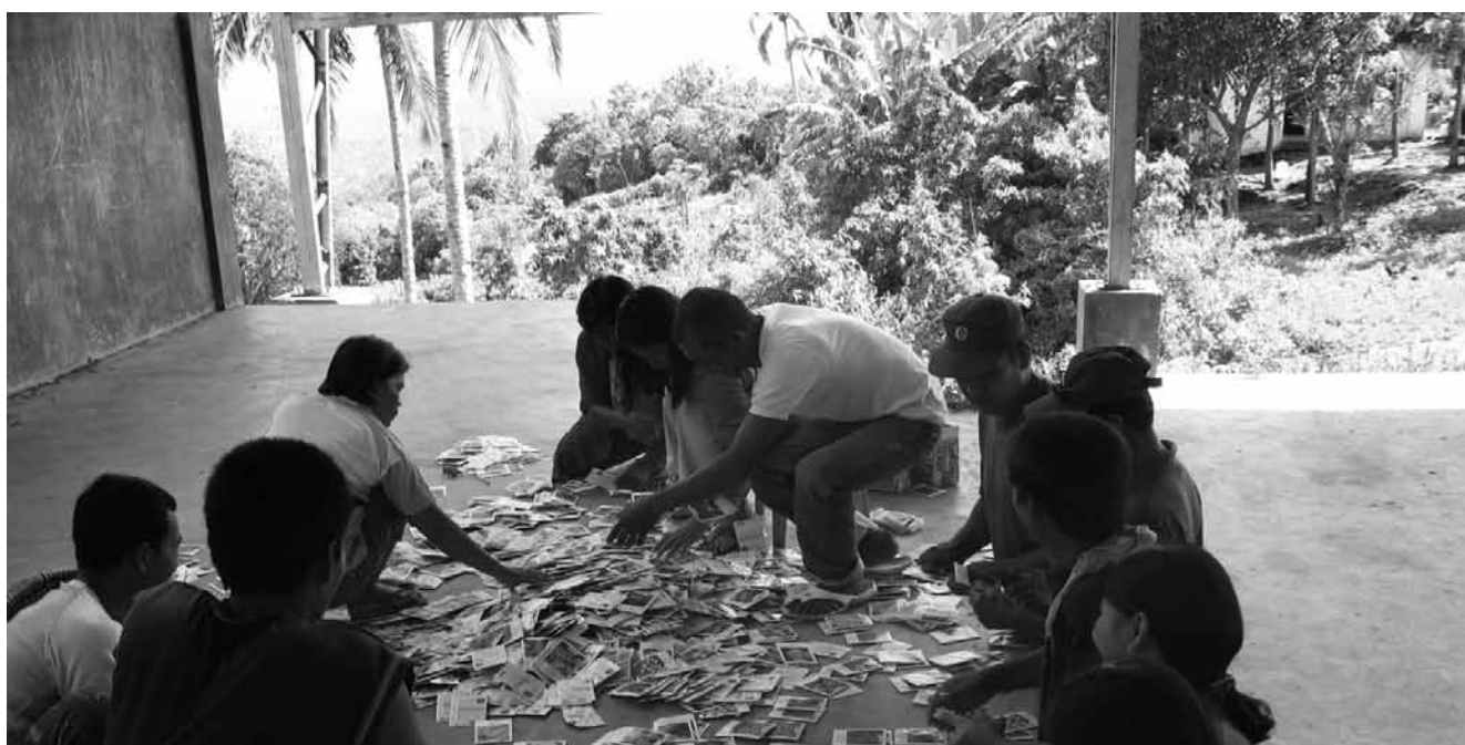
Campesinas y campesinos seleccionando semillas.

InteRed está apoyando, desde agosto de 2008, la labor de Josefa Segovia Foundation , ONG local en Filipinas, en sus esfuerzos por contribuir a la reducción de la pobreza en 31 comunidades rurales (denominados “Barangays”) a través de las acciones que se han realizado en el marco del proyecto “Fortalecimiento de estructuras sociales y productivas para la reducción de la pobreza en 31 Barangays de Calinan, Marilog y Baguio” cofinanciado por la Junta de Comunidades de Castilla la Mancha.