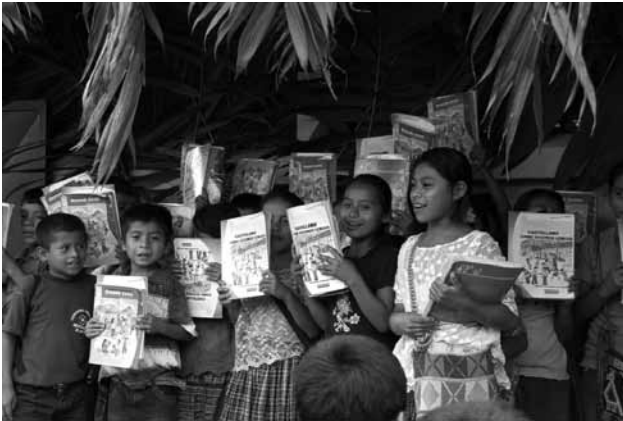
Entrega de material escolar a niños y niñas guatemaltecos.

definido los lineamientos de la Reforma Educativa guatemalteca desde la sociedad civil. Podemos decir que pretendemos convertir en realidad el derecho humano a la educación con equidad , poniendo un énfasis en los aspectos que atañen al Pueblo Maya y en general a los grupos desfavorecidos del país.