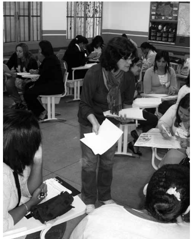
Formación de profesorado.

Este Movimiento independiente ha demostrado tener incidencia política consiguiendo la implicación de las administraciones públicas locales en sus actividades y ha favorecido una mayor tolerancia y una reducción de la violencia social"