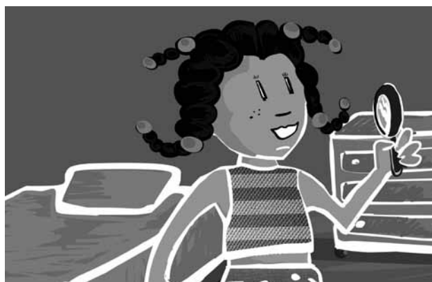
Viñeta de los dibujos animados “Zora soñadora”

La iniciativa recoge actividades didácticas para los ciclos educativos de Infantil, Primaria y Secundaria e