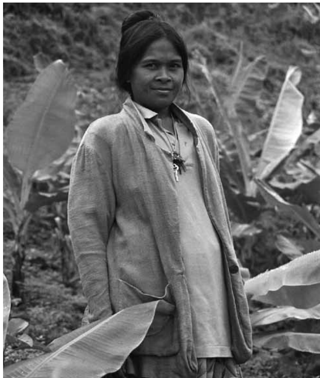
Campesina del distrito tres de Davao (Filipinas).

Con el objetivo de fortalecer a las administraciones públicas locales para que definan y promuevan programas concretos para mejorar las condiciones de las comunidades y contribuir a garantizar por lo tanto el disfrute a sus derechos, se ha formado a los cargos electos en temas como el código de gobierno local, que marca las directrices y principios legales de todo gobierno, procedimientos parlamentarios, etc. Como elemento clave para el desarrollo de las comu-