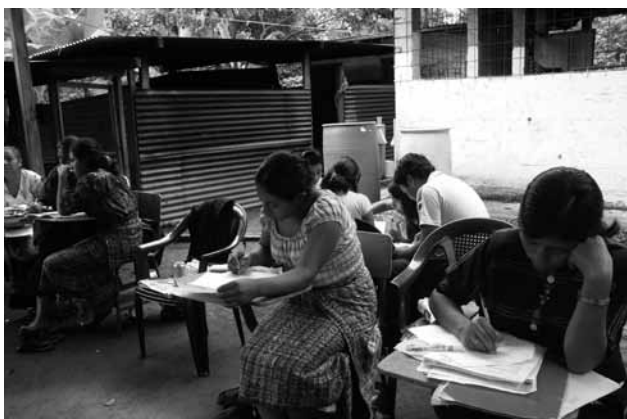
Mujeres en clase de alfabetización. Guatemala.

participantes desarrollan la habilidad de lecto-escritura y cálculo matemático básico. Para ello se utiliza la cartilla “La Semilla” basada en el método psicosocial, que parte de palabras generadoras tomadas del grupo humano de la región donde se implementa el proceso. Por los objetivos que se persiguen se plantea un enfoque de género, multicultural y de derechos que busca promover el cambio social de las mujeres campesinas a partir de la reflexión crítica de su realidad. Seguidamente se implementan los procesos I y II de post-alfabetización equivalentes al tercero y sexto grado de primaria respectivamente.