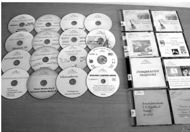
Materiales y experiencias didácticas.

Si bien la asistencia escolar y los servicios educativos han progresado, los principales problemas se presentan en la calidad de la educación y en la infraestructura educativa limitada. La mejora de la calidad de educación implica, no sólo alcanzar altos niveles de programas de capacitación que mejoren la formación académica de los docentes y su cualificación profesional, sino tener como meta lograr docentes autónomos y comprometidos con el cambio socioeducativo y con la construcción de la comunidad educativa de Villa El Salvador para recuperar una educación como base del desarrollo y derecho humano para todas y todos. La educación vista desde su responsabilidad social en la dignidad de la persona, exige también la promoción de la ciudadanía, la inclusión social y la creación de condiciones para hacer frente a las exigencias del desarrollo que pide la comunidad.