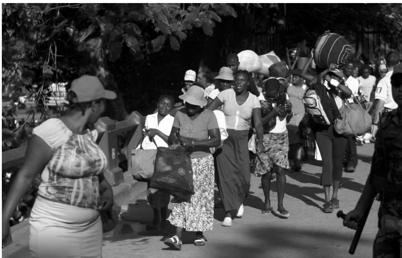
Mujeres haitianas cruzando la frontera con sus mercancías.

El Ayuntamiento de Córdoba, InteRed y el Centro Puente de Dominicana trabajan en la formación de derechos a mujeres con escasos recursos en la frontera norte de República Dominicana y Haití.