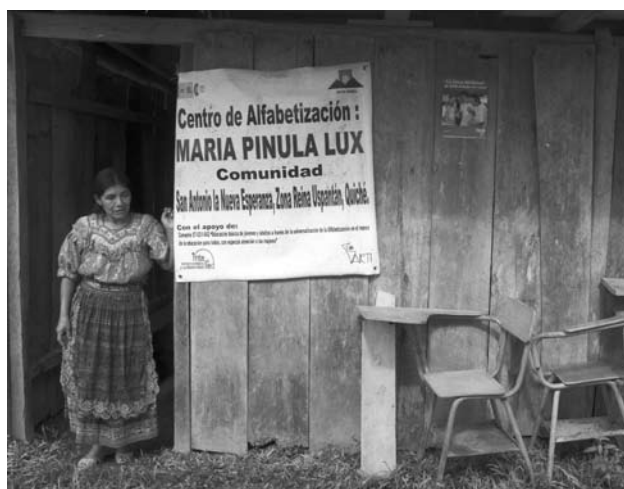
Centro de alfabetización en la comunidad Nueva Esperanza, zona Reina Uspantán, Quiché (Guatemala)