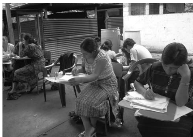
Evaluación final de un grupo de alfabetización en Guatemala.

“Ahora, me sorprende cuando voy a la municipalidad y miro a mujeres participando en los Consejos de Desarrollo, en los comités y miro a los grupos de mujeres sentadas frente al alcalde presentándole un proyecto.