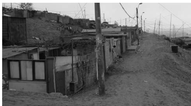
Una de las zona de Villa El Salvador , Lima (Perú).

en la ciudadanía activa que se compromete con los cambios sociales desde una interpretación de la educación como un factor transformador, donde la acción educativa favorece una educación comprometida con la sociedad. En este sentido: