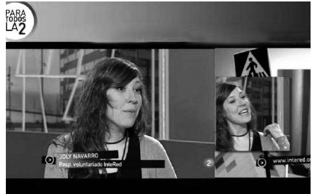
El documental de InteRed, "Trueque", tuvo una gran acogida en TVE con su emisión y entrevistas en varios espacios informativos y de programas.

Por delante nos queda un año de mucha actividad, en el que junto a otras organizaciones del ámbito