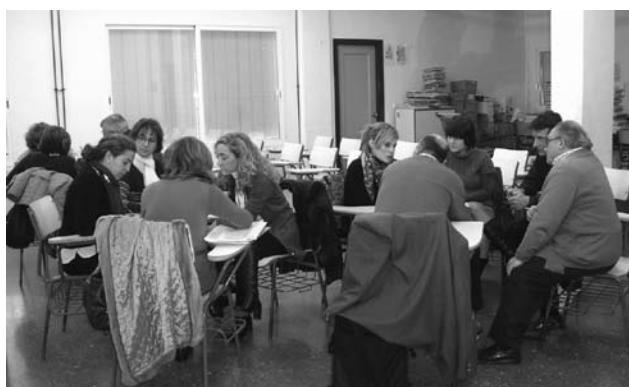
Taller participativo con el claustro del Centro de Enseñanzas de Infantil y Primaria, García Navarro. Sevilla.

Las acciones se desarrollan en 26 centros educativos de 20 provincias distintas pertenecientes a 10 Comunidades Autónomas del Estado Español y en 2 colegios mayores de Zaragoza y Valladolid. De los 3 componentes estratégicos identificados para contribuir al fortalecimiento de capacidades de las comunidades educativas para la promoción de una ciudadanía global, crítica, responsable y comprometida con el logro del Desarrollo Humano y Sostenible y los Derechos Humanos, se han llevado a cabo los siguientes avances: