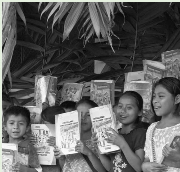
Comunidad Río Azul. Guatemala.

Los procesos de globalización mundial presentan desafíos cada vez mayores para los pueblos indígenas, que se enfrentan al riesgo de una pérdida acelerada de su entorno y su cultura. Perú con un 62% de territorio amazónico es el primer país con mayor población indígena amazónica en América latina y el segundo con mayor diversidad en pueblos indígenas. Se estima que está compuesto por 8 millones de quechuas, 603.000 aymaras y 350.000 indígenas que pertenecen a 65 grupos étnicos agrupados en 12 familias lingüísticas que comprende cada uno idiomas oficiales en los lugares donde la mayoría de la población lo habla. En Perú se estima que han desaparecido, física o culturalmente, 11 grupos; y otros 18 están en proceso de extinción al contar con poblaciones muy reducidas.