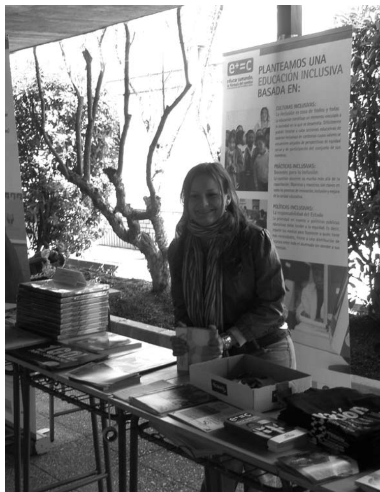
InteRed en el Día de la Solidaridad del Instituto Veritas.