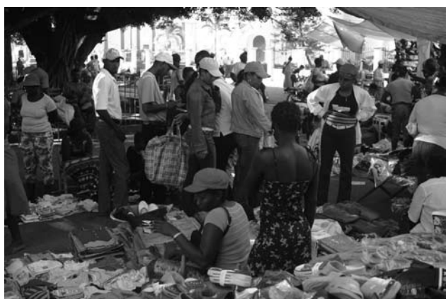
Mercado ambulante en la provincia de Dajabón. República Dominicana.

La situación de estas mujeres viene condicionada por el empobrecimiento femenino y la discriminación de género; agravada por el hecho de que ser mujer, negra, pobre, inmigrante y haitiana son sometidas a constantes violaciones de sus derechos en la frontera: A muchas de ellas las despojan de sus mercancías o vuelven a pagar por ellas. El proyecto tiene la finalidad de dar apoyo, asesoramiento y acompañar legalmente a estas mujeres para que conozcan sus derechos e identifiquen las vejaciones a las que se ven sometidas muchas de ellas al traspasar la frontera para la venta de sus mercancías.