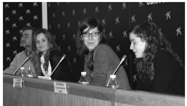
Presentación del documental en Caixa Forum de Madrid. Se habló de la formación, el compromiso y la participación como claves del voluntariado.

nacional, participaremos al lado de las personas voluntarias en espacios de formación y de reflexión.