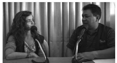
Fotogramas de las tres experiencias de voluntariado en Bolivia.