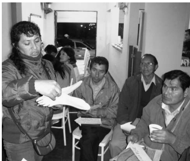
Sesión de trabajo con profesorado.

“Promoviendo el ejercicio ciudadano en Villa El Salvador mediante procesos socioeducativos en la escuela y en la comunidad”, es un proyecto que se desarrolla en Perú, cofinanciado por la Junta de Comunidades de Castilla la Mancha e InteRed, que tiene por finalidad una educación comprometida con la comunidad para construir una sociedad democrática y solidaria.