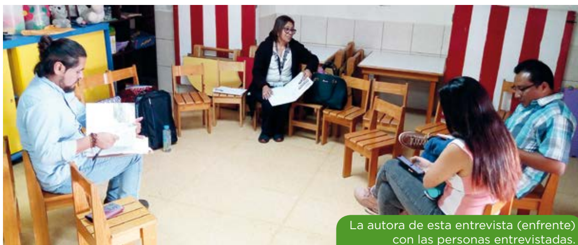
La autora de esta entrevista (enfrente) con las personas entrevistadas.

Un resultado de la creación de los Espacios Amigables fue la firma de una carta de acuerdo con el Centro de Salud, donde se estableció la puesta en práctica de la Atención Integral y Diferenciada para Adolescentes y Jóvenes . En ella se estableció que cada dos meses se dará atención exclusiva a esta población, haciendo uso de todos los servicios. Esto es ya un resultado importante. También hemos podido constatar cómo adolescentes y jóvenes empezaron a realizar el trabajo de sensibilización con sus pares, así como la importancia de los Espacios Amigables para dar respuesta a dudas y la atención directa a sus necesidades.