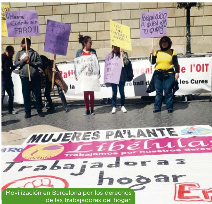
Movilización en Barcelona por los derechos de las trabajadoras del hogar.

La Red integra a organizaciones de mujeres migradas que visibilizan esta situación, a través de acciones de incidencia política para avanzar en términos de justicia y transformación social, para que se hagan visibles sus necesidades y estrategias de acción colectiva.