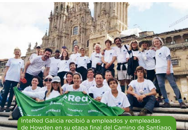
InteRed Galicia recibió a empleados y empleadas de Howden en su etapa final del Camino de Santiago.