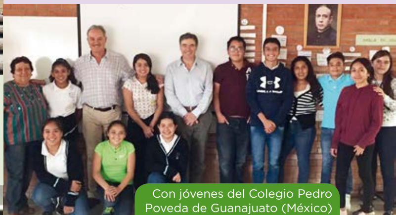
Con jóvenes del Colegio Pedro Poveda de Guanajuato (México)

“La Responsabilidad Social Corporativa empieza por la gente que trabaja contigo cada día, por las oportunidades que les das para que crezcan. Pero conforme vas creciendo como empresa y la presencia internacional se va haciendo más evidente, te das cuenta de que puedes hacer más. Entonces es cuando nace ese compromiso, que es la respuesta hacia un mundo mejor . Cuando te comprometes como empresa, socialmente, tomas partido; entonces la RSC cobra una nueva dimensión”.