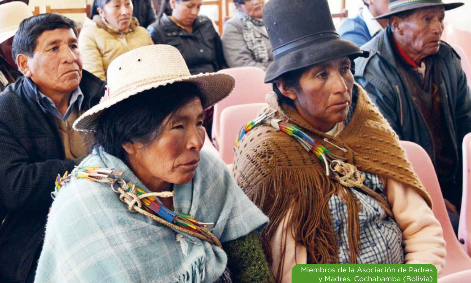
Miembros de la Asociación de Padres y Madres. Cochabamba (Bolivia)