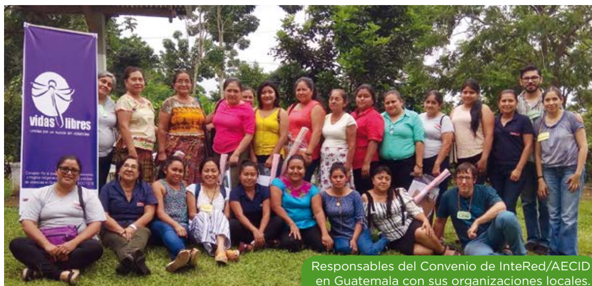
Responsables del Convenio de InteRed/AECID en Guatemala con sus organizaciones locales.