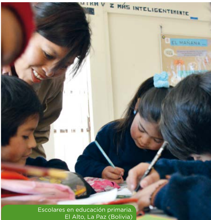
Escolares en educación primaria. El Alto, La Paz (Bolivia)

También destacamos los apthapis (comida comunitaria intergeneracional) que han servido para revalorizar el papel de las mujeres en las comunidades, recuperando y valorando sus saberes y conocimientos sobre formas de preparación y conservación de los alimentos, plantas medicinales, etc. Los apthapis reforzaron la conexión entre los productos alimenticios y el bienestar del cuerpo y el alma, poniendo en el centro el cuidado de la vida.