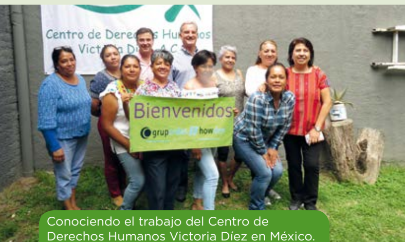
Conociendo el trabajo del Centro de Derechos Humanos Victoria Díez en México.

“Escogí InteRed porque una de las cosas que percibo a través de mi trabajo es lo injusto que es el mundo y con lo único que no puedo es que alguien nazca y no tenga esperanza. InteRed, a través de sus actuaciones, nos dota de sentido ”.