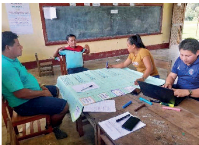
Profesorado de la comunidad de Aushiri reflexionando sobre la práctica docente.

Este programa educativo beneficia a 569 niñas y niños (258 hombres y 311 mujeres), del pueblo kichwa, quienes son estudiantes de escuelas primarias públicas, mejorando su entorno de aprendizaje: mejora de servicios higiénicos y lavabos, electricidad (se cuenta ya con 7 paneles solares), materiales pedagógicos; además, se ha capacitado a 150 docentes de escuelas públicas fortaleciendo sus competencias para la enseñanza de la lectura y escritura en contextos bilingües kichwas-castellano; también participan alrededor de 250 miembros de las familias, quienes comparten sus saberes con el alumnado; Por último, se ha buscado for-