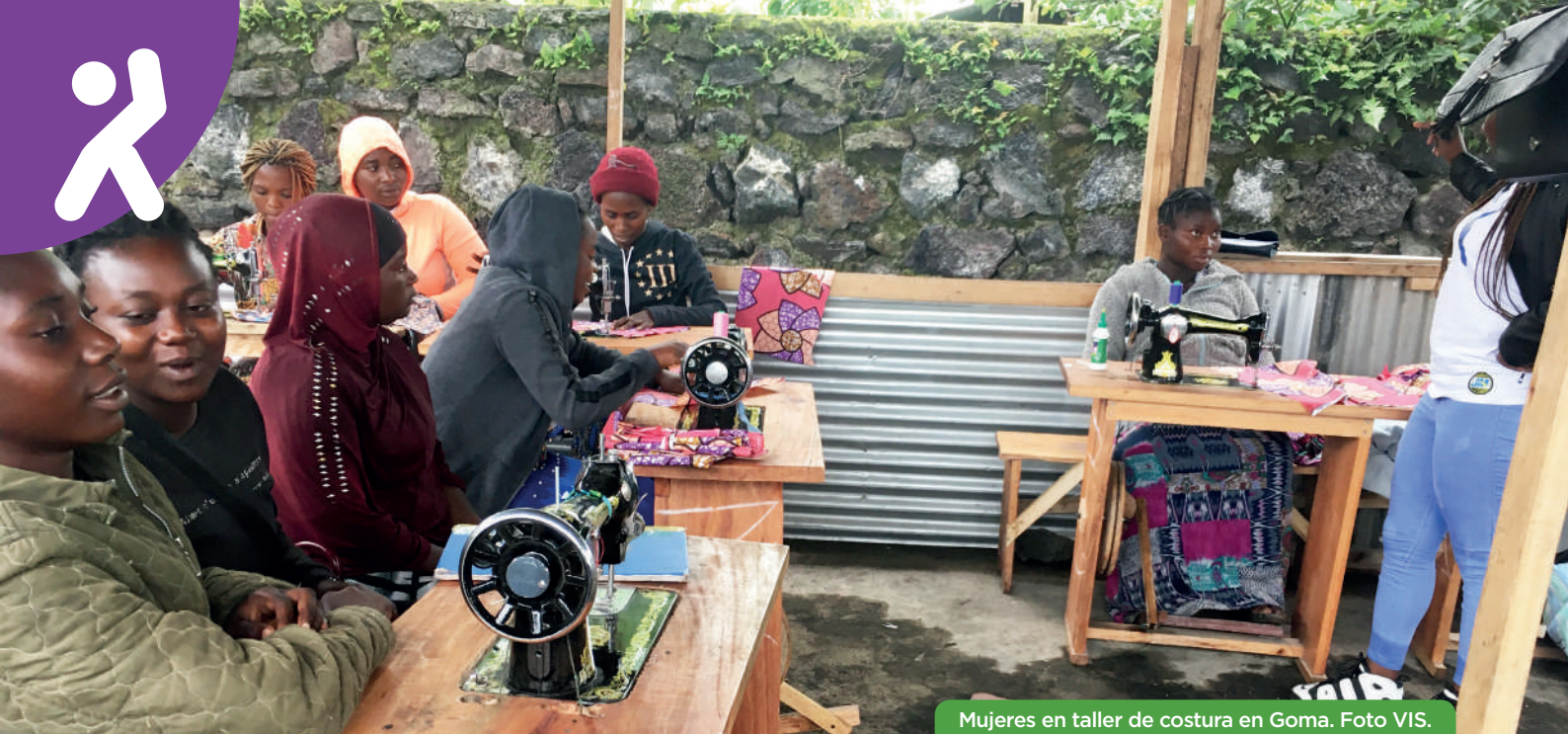
Mujeres en taller de costura en Goma.