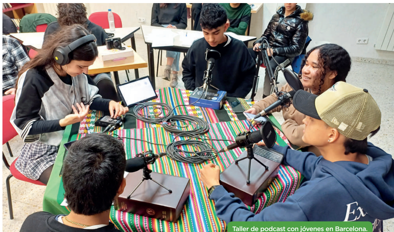
Taller de podcast con jóvenes en Barcelona.