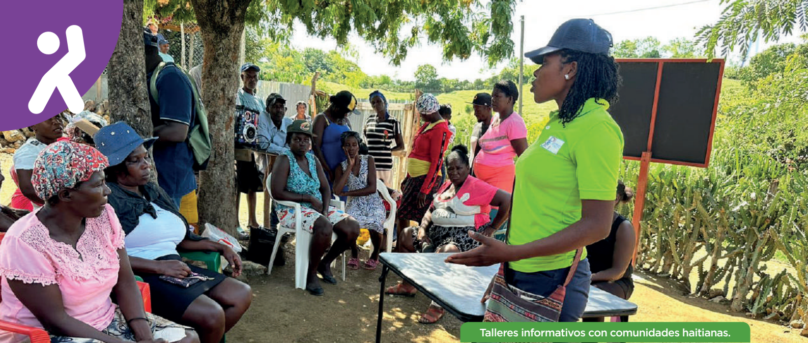
Talleres informativos con comunidades haitianas.