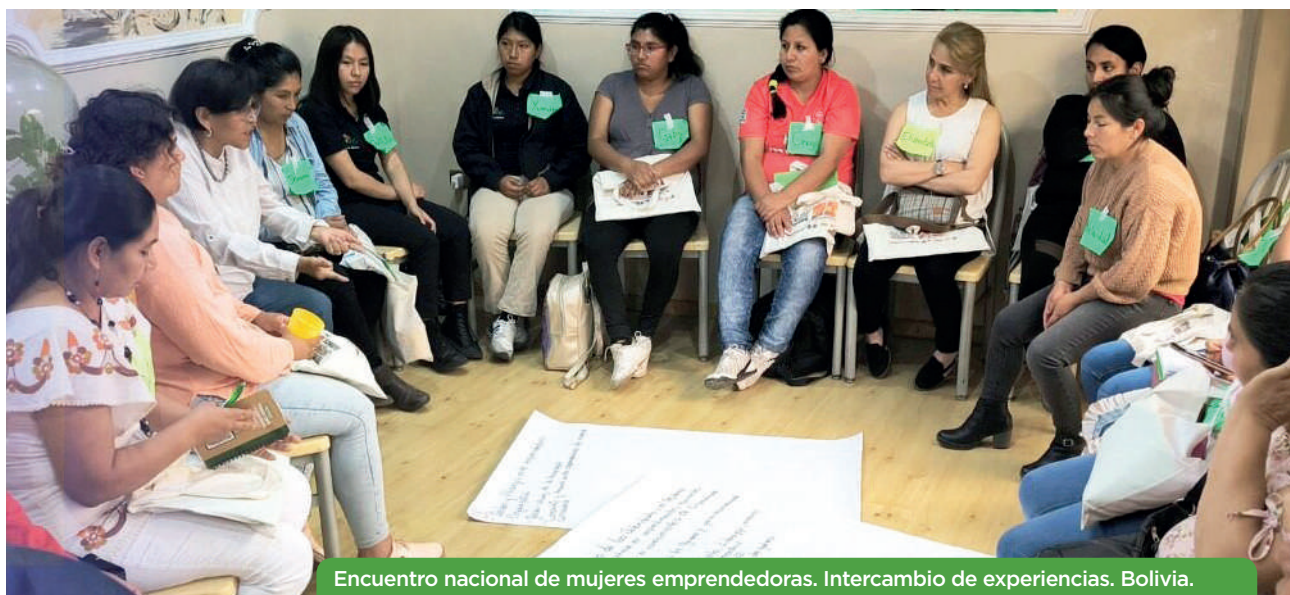
Encuentro nacional de mujeres emprendedoras. Intercambio de experiencias. Bolivia.