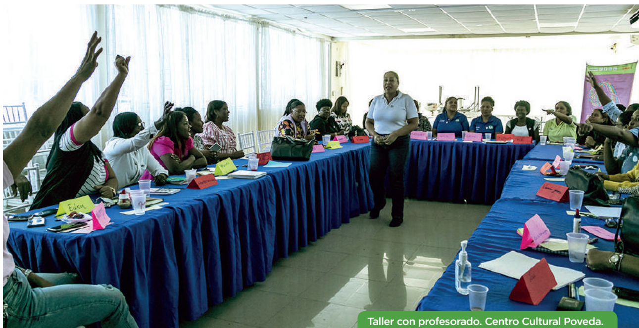
Taller con profesorado. Centro Cultural Poveda.

La formación continua del personal educativo ha sido crucial, con una fuerte participación en los procesos en la lucha contra el embarazo adolescente y la violencia de género, con la implementación de un Diplomado, con el reconocimiento del Ministerio de Educación dominicano que ha promovido la equidad de género y la sensibilización. Se han implementado programas de coeducación que no solo benefician a los estudian-