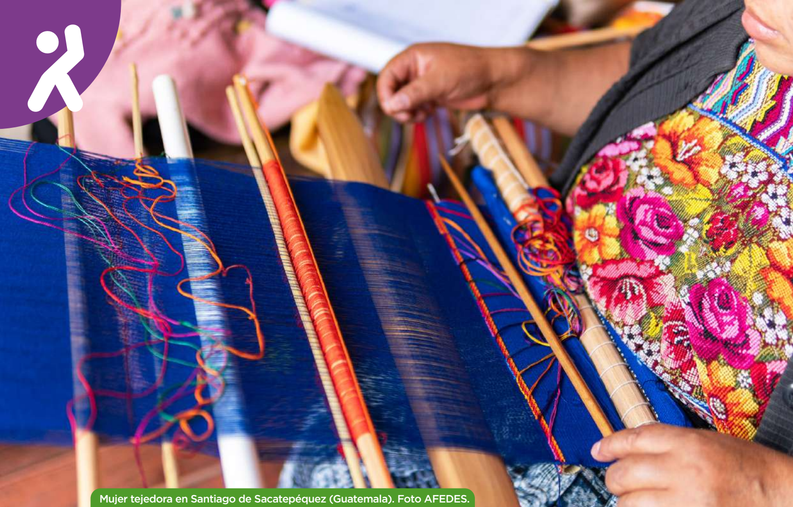
Mujer tejedora en Santiago de Sacatepéquez (Guatemala).