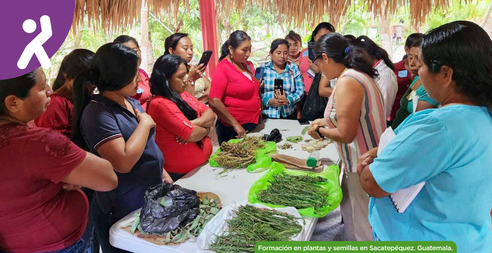
Formación en plantas y semillas en Sacatepéquez. Guatemala.