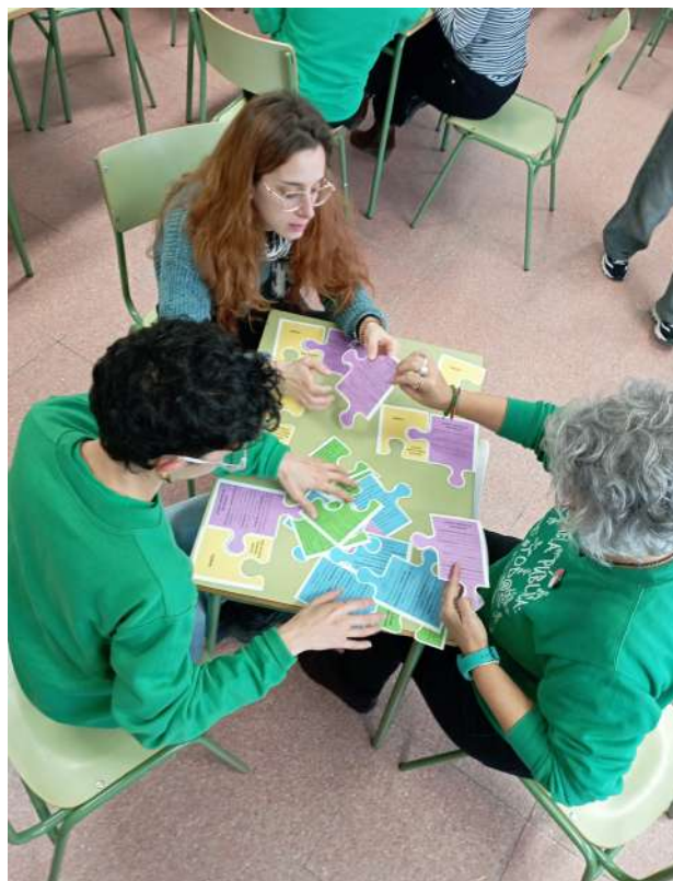
Jóvenes y mayores: un intercambio de saberes enriquecedor. InteRed Madrid.

Otros grupos han aprendido a coser y remendar de la mano de mujeres que llevan practicando la circularidad de la ropa toda una vida. En estos espacios intergeneracionales han problematizado el impacto del fast-fashion y sus consecuencias socioambientales, y revalorizado el diseño y confección de sus propias prendas y la de sus amistades y familiares. Cuidar la vida es remendar; es no consumir prendas fabricadas por personas sin derechos laborales dignos; es saber mirar las etiquetas y saber de dónde vienen los tejidos; es tejer algo para alguien que quieres. Resulta que “cuidar la vida” es una acción cercana y concreta, más de lo que imaginábamos.