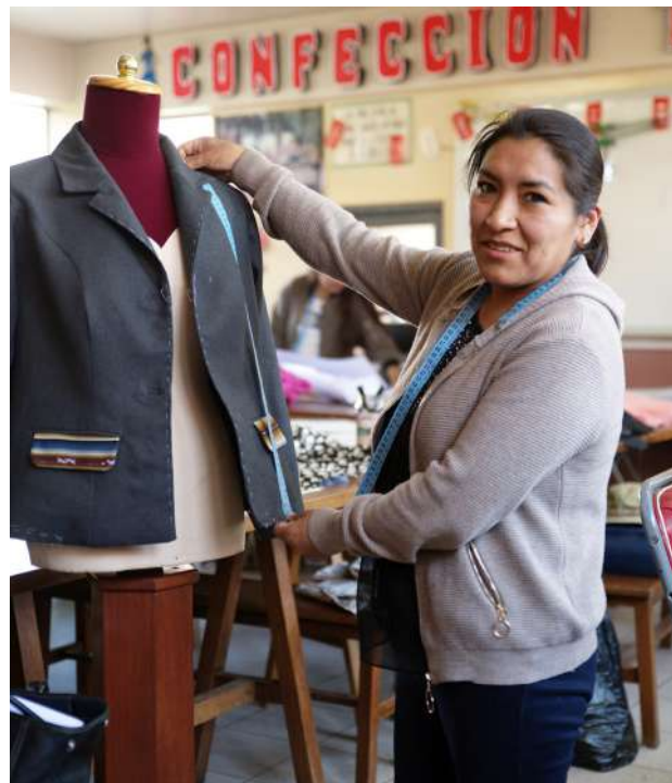
Centro de Educación Alternativa El Alto. La Paz (Bolivia)

rricular para que la oferta formativa de estos Centros esté articulada y responda a las vocaciones productivas de los territorios y a la demanda de los mercados laborales. También, se trabaja por actualizar y complementar la formación de docentes, tanto en sus especialidades técnicas, como en enfoques de género, medio ambiente, emprendedurismo, empleabilidad, entre otros, y se mejora la infraestructura y equipamiento de las carreras técnicas.