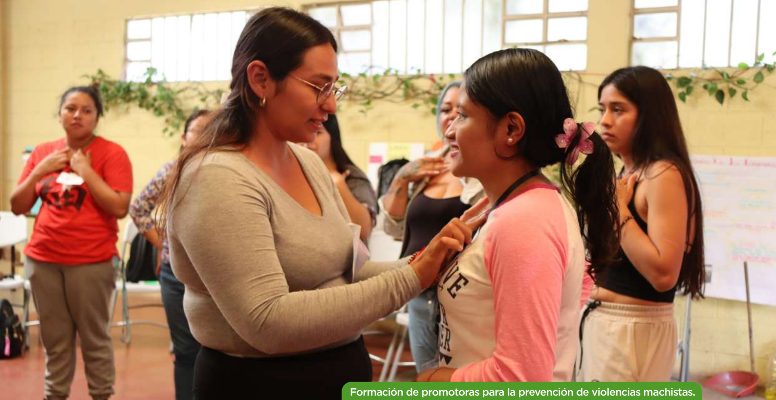
Formación de promotoras para la prevención de violencias machistas.