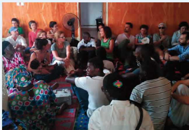
En el seminario celebrado en Senegal para los premiados se intercambiaron experiencias educativas y se reflexionó sobre el enfoque de educación para el desarrollo en el aula.