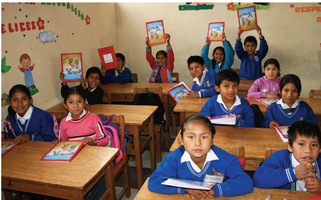
Escolarización en una escuela rural de Ayacucho (Perú). InteRed.