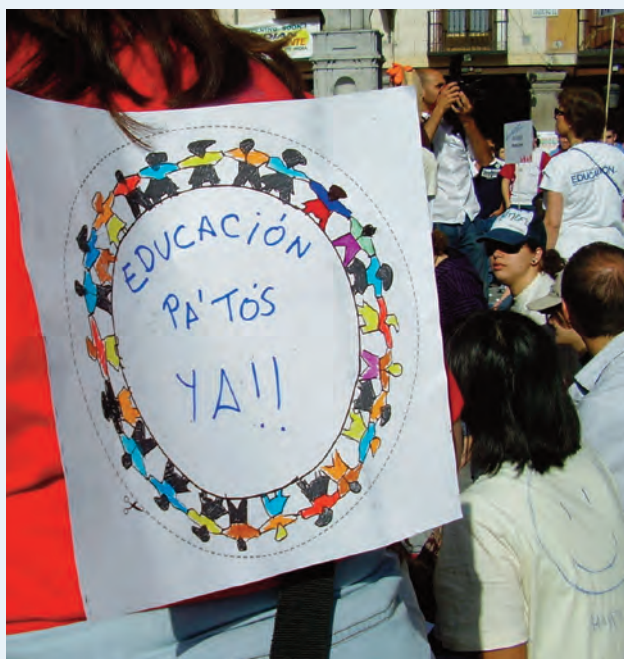
Movilización de la Campaña Mundial por la Educación en Madrid.

En consonancia con esta visión de UNESCO, las ONGD que hacemos Educación Transformadora entendemos la Educación Transformadora y para la Ciudadanía Global (ETCG) como un proceso socio-educativo continuado que promueve una ciudadanía global crítica, responsable y comprometida, a nivel personal y colectivo, con la transformación de la realidad local y global para construir un mundo más justo, más equitativo y más respetuoso con la diversidad y con el medio ambiente, en el que todas las personas podamos desarrollarnos libre y satisfactoriamente. La ETCG fomenta el respeto y la valoración de la diversidad como fuente de enriquecimiento humano, la conciencia ambiental y el consumo responsable, el respeto de los derechos humanos individuales y sociales, la equidad de género, la valoración del diálogo como herramienta para la resolución pacífica de los conflictos y la participación democrática, la corresponsabilidad y el compromiso en la construcción de una sociedad justa, equitativa y solidaria.