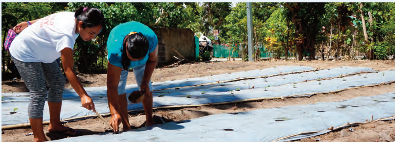
Mujeres en su huerto comunitario en Sorsogón (Filipinas).

Y respecto a la salud, se ha colaborado con la Unidad Rural de Salud (RHU) para diseñar y llevar a cabo las campañas de sensibilización sobre salud, agua y saneamiento, y se han impartido talleres sobre soporte vital básico para los agentes de salud de los 5 barangays y el personal del RHU, en coordinación con la oficina provincial de salud.