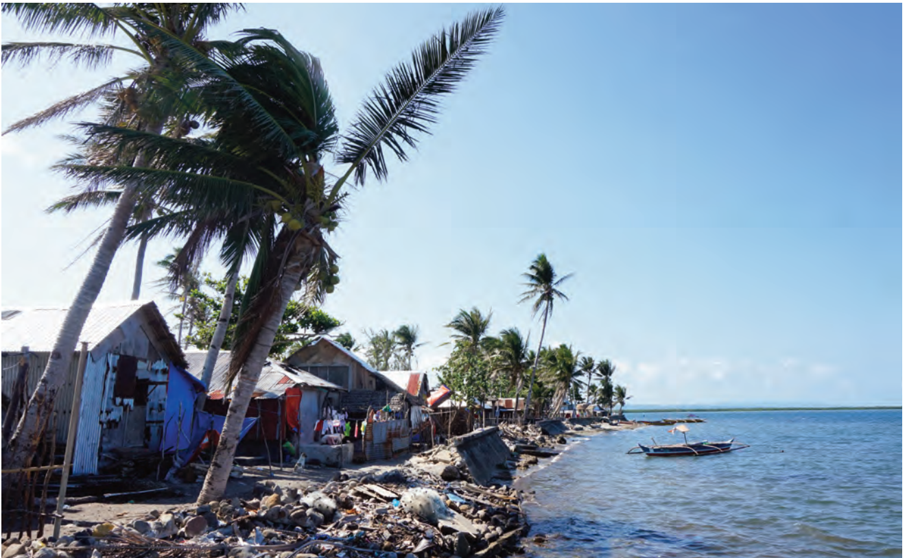
Población Norte. Sorsogón – Bicol (Filipinas).

“ El nivel de pobreza en Filipinas es considerablemente alto. Dependiendo de las zonas, las preocupaciones varían: pobreza altísima en las calles, difícil acceso a la educación, inundaciones, tifones, poca integración de las mujeres en las organizaciones comunitarias, difícil acceso al agua potable y muchas enfermedades ”