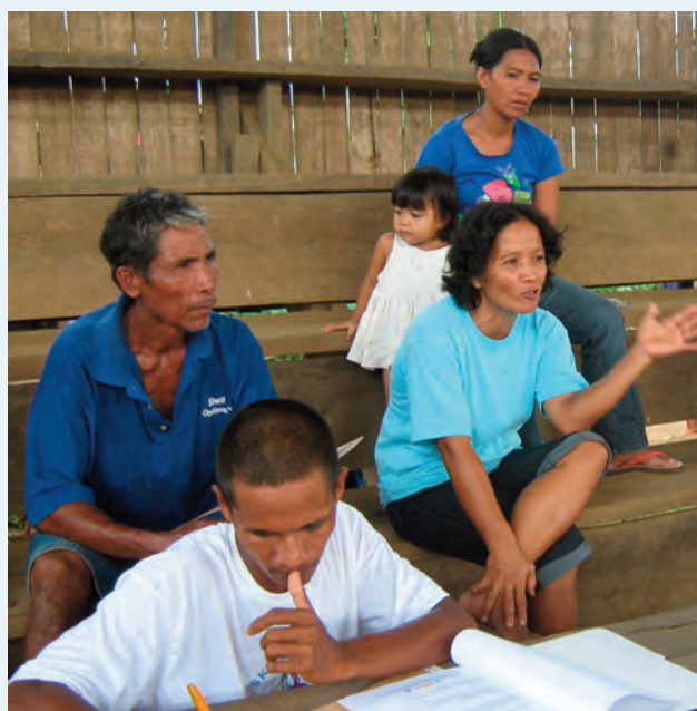
Formación a comunidades filipinas en sostenibilidad alimentaria.

La zona de intervención está situada en un cinturón de tifones donde entran o se originan el 65% de los ciclones que se convierten en los desastres más frecuentes y dañinos de Filipinas, siendo el