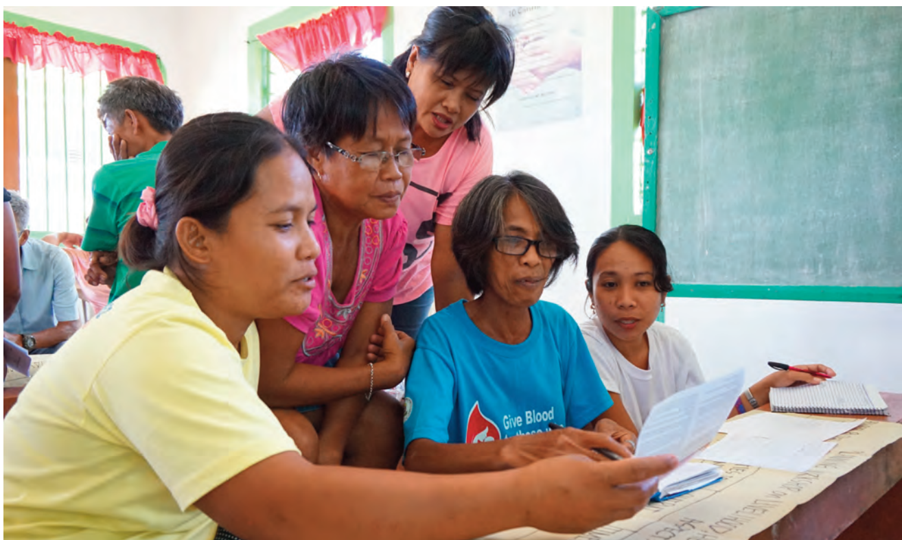
Sorsogón - Bicol (Filipinas).

“ Nuestras acciones están orientadas hacia las 4 fases de la gestión de desastres: prevención y mitigación, preparación, respuesta y rehabilitación; actualizando y perfeccionando los planes de contingencia y sistemas de alerta temprana ”