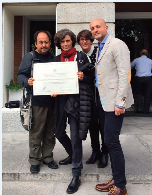
Representación del centro educativo premiado con dos personas técnicas de la línea de educación de InteRed.

Este proceso de sensibilización colectiva ha sido posible gracias al esfuerzo conjunto del profesorado del centro y de distintas entidades locales, nacionales e internacionales, entre las que se encuentra InteRed, la Asociación Andaluza por la Solidaridad y la Paz (ASPA), Mujeres en Zona de Conflicto (MZC), Cruz Roja y Medicus Mundi. Un trabajo en red que ha estado orientado prioritariamente a empoderar a jóvenes estudiantes para que se conviertan en motor de cambio de nuestras sociedades, actuando como multiplicadores de los mensajes y reflexiones surgidas en las distintas actividades.