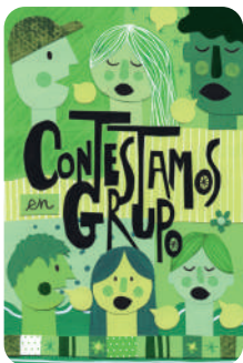
Contestamos en grupo