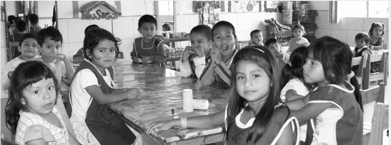
Escolares en la Fundación Pedro Poveda de Chinautla (Guatemala).

centro, ha conseguido que la Supervisión Educativa permita el apoyo en formación y capacitación del profesorado de las escuelas públicas de la zona, porque ampliando las acciones hacia el profesorado, pueden incidir directamente en la calidad educativa del aula.