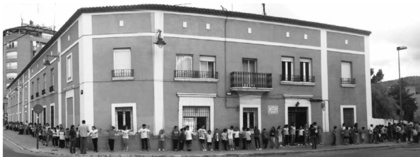
Colegio José Arnauda “abrazo” a su cole en Alcoy (Alicante).

Es una iniciativa que muestra el compromiso de los centros educativos con el cuidado de las personas y la educación, en el marco de la campaña de InteRed “Actúa con Cuidados. Transforma la realidad”.