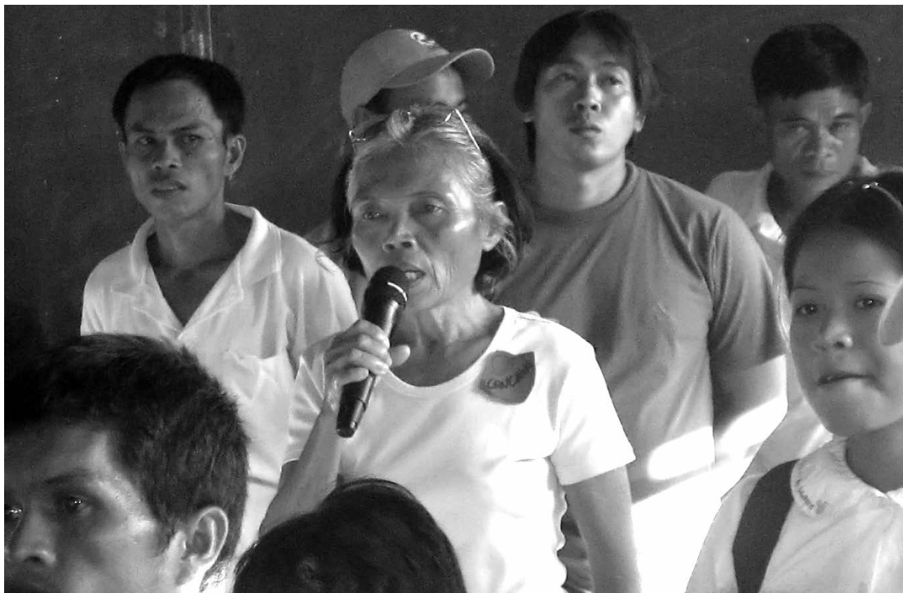
Participación de las mujeres en temas que las afectan, la agricultura.

Desde el trabajo que ha impulsado InteRed en Bicol y Caraga se ha iniciado el proceso por el que los espacios de participación ciudadana en los Gobiernos Locales se reconozcan y funcionen. Paralelamente, se ha trabajado con las y los miembros de las comunidades para que tomen conciencia de sus derechos y los reivindiquen.