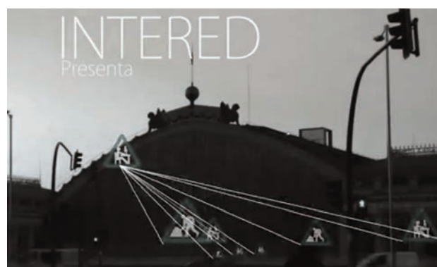
Audiovisual de la campaña de InteRed “ Actúa con cuidados. Transforma la realidad ”.

A lo largo de este último trimestre InteRed ha elaborado el material escolar “ Cómo ser un cole de cuidado ” enmarcado dentro de su trabajo en centros educativos, destinado al alumnado de secundaria y Bachillerato . El tríptico recoge una explicación sencilla sobre los objetivos de la campaña de Cuidados y propone al alumnado ideas concretas para conseguir que el centro educativo ponga los cuidados en el centro de su vida y su actividad. Bajo el epígrafe “ ¿Sabes que en tu centro educativo te cuidan? ¿y que tú también lo haces? ” la campaña otorga al alumnado un papel protagonista en dicha transformación.