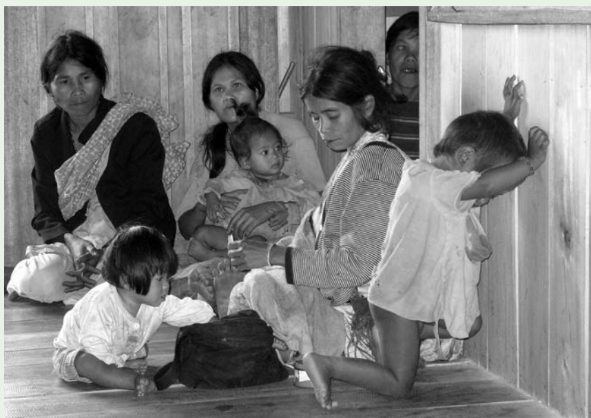
Desarrollo rural con poblaciones indígenas. Caraga. Filipinas.

feridos a la gestión y administración estatal y local ausente o débil, económicos , en referencia a la brecha de clases, falta de equipamientos suficientes y viviendas frágiles; sociales , en cuanto a desigualdades sociales y densidad de la población; educacionales , relacionados con la calidad de la educación y formación de la población en situaciones de desastres; y ambientales , referido al monopolio de empresas transnacionales y su desconsideración humana y ecológica, además de los desequilibrios climáticos... Todos son problemas estructurales de fondo, pero, lo cierto es que cada vez que se pierden vidas humanas, la culpa es de la naturaleza.