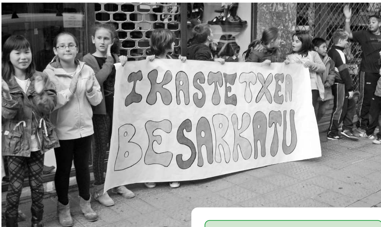
Colegio Ikasbide de Bilbao "abrazo" a su cole.

A través de la presente campaña, cofinanciada por la Agencia Española de Cooperación Internacional para el Desarrollo (AECID), InteRed quiere, primero, visibilizar y reconocer el trabajo de los cuidados como imprescindibles para el sostenimiento de la vida y las sociedades; y segundo, que la responsabilidad de los cuidados, tradicionalmente considerados femeninos, debe ser compartida y corresponde a toda la sociedad hacerse cargo de ella.