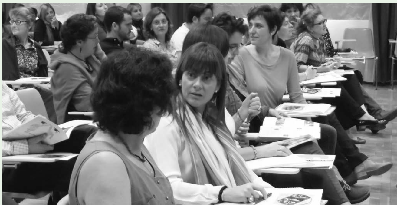
Sesión del III Encuentro de la Red de Centros celebrada en el hotel escuela de la Comunidad de Madrid.