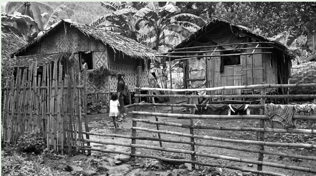
Barangays, casas rurales filipinas.

Estos aspectos toman una mayor relevancia puesto que son los que determinan realmente que los sistemas de protección sean promovidos y desarrollados.