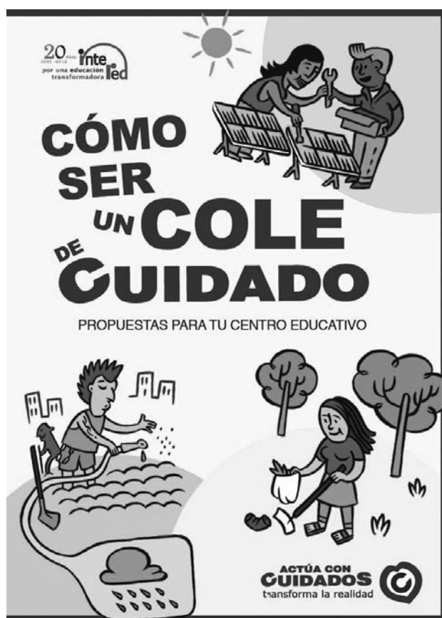
Material escolar para bachillerato y secundaria.

“ Cómo ser un cole de cuidado ” se ha distribuido por centros educativos de toda España y está accesible a toda la comunidad educativa en la web de la campaña: www.actuaconcuidados.org