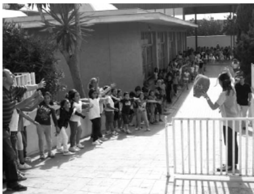
Colegio El Armelar “abrazo” su cole en Paterna (Valencia).

Uno de los principales ejes del trabajo de InteRed tanto de cooperación internacional como de educación para el desarrollo está referido a la incorporación del enfoque de género y derechos humanos en todas nuestras acciones; así son numerosos los proyectos dirigidos a docentes, estudiantes, padres y madres para educar en la igualdad a mujeres y hombres, favoreciendo así las relaciones de justicia y equidad en la familia y en la sociedad.