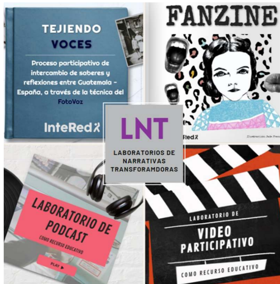
Ejemplos de formatos de los Laboratorios de Narrativas Transformadoras (LNT).