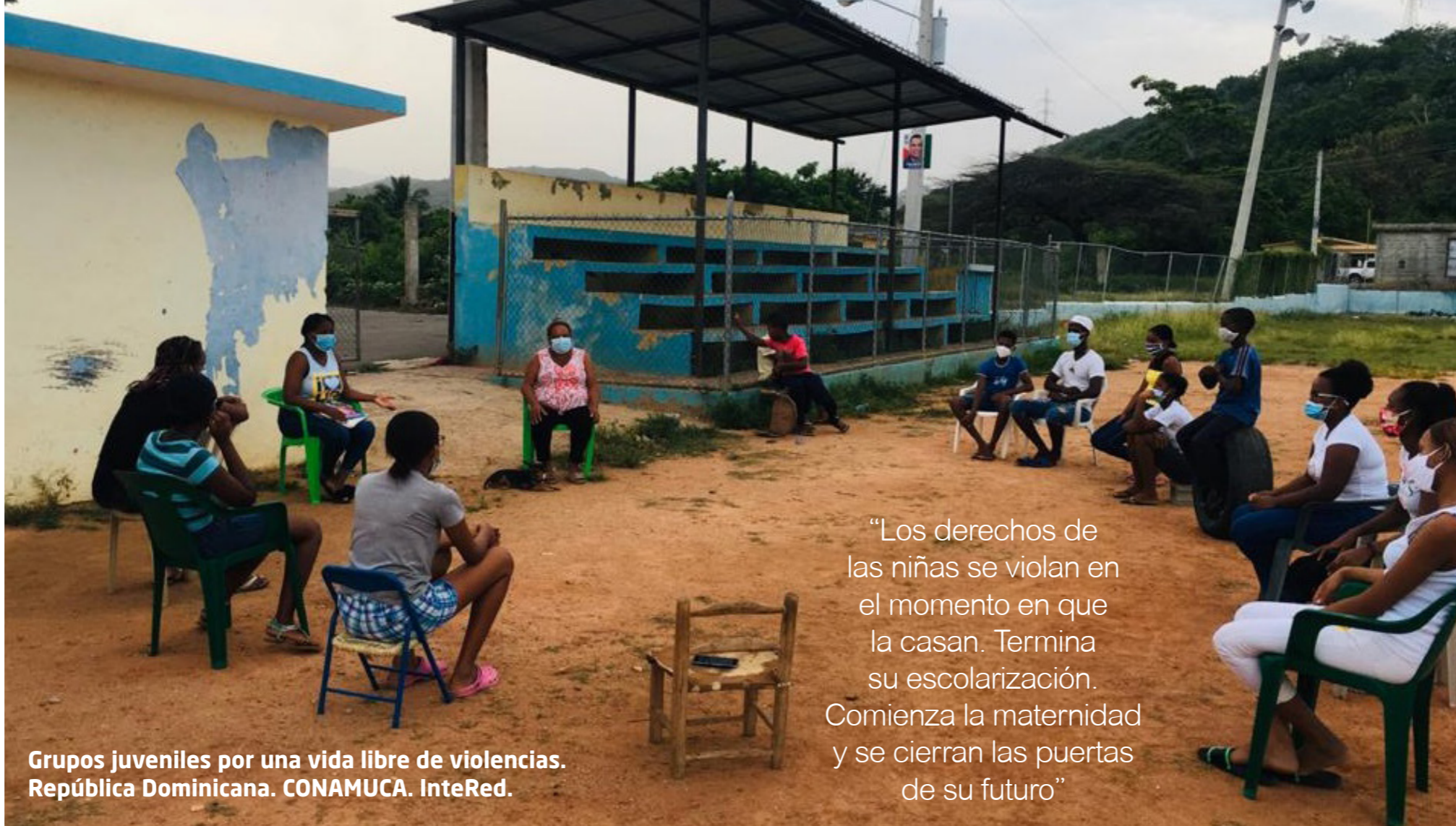
Grupos juveniles por una vida libre de violencias. República Dominicana. CONAMUCA. InteRed.

la provincia de San Cristóbal, una de las regiones con mayores índices de violencia de género y embarazo adolescente, y en coordinación con las organizaciones socias locales en República Dominicana: el Centro Cultural Poveda, la Confederación Nacional de Mujeres del Campo, el Centro de Solidaridad para el Desarrollo de la Mujeres y el Centro de Planificación y Acción Ecu-ménica, desarrolla, el Convenio, a cuatro años: "Por el derecho de mujeres, jóvenes y niñas a una vida libre de violencias, incidiendo en la prevención desde el ámbito educativo y comunitario para la reducción de la violencia basada en género y la prevalencia del embarazo adolescente".