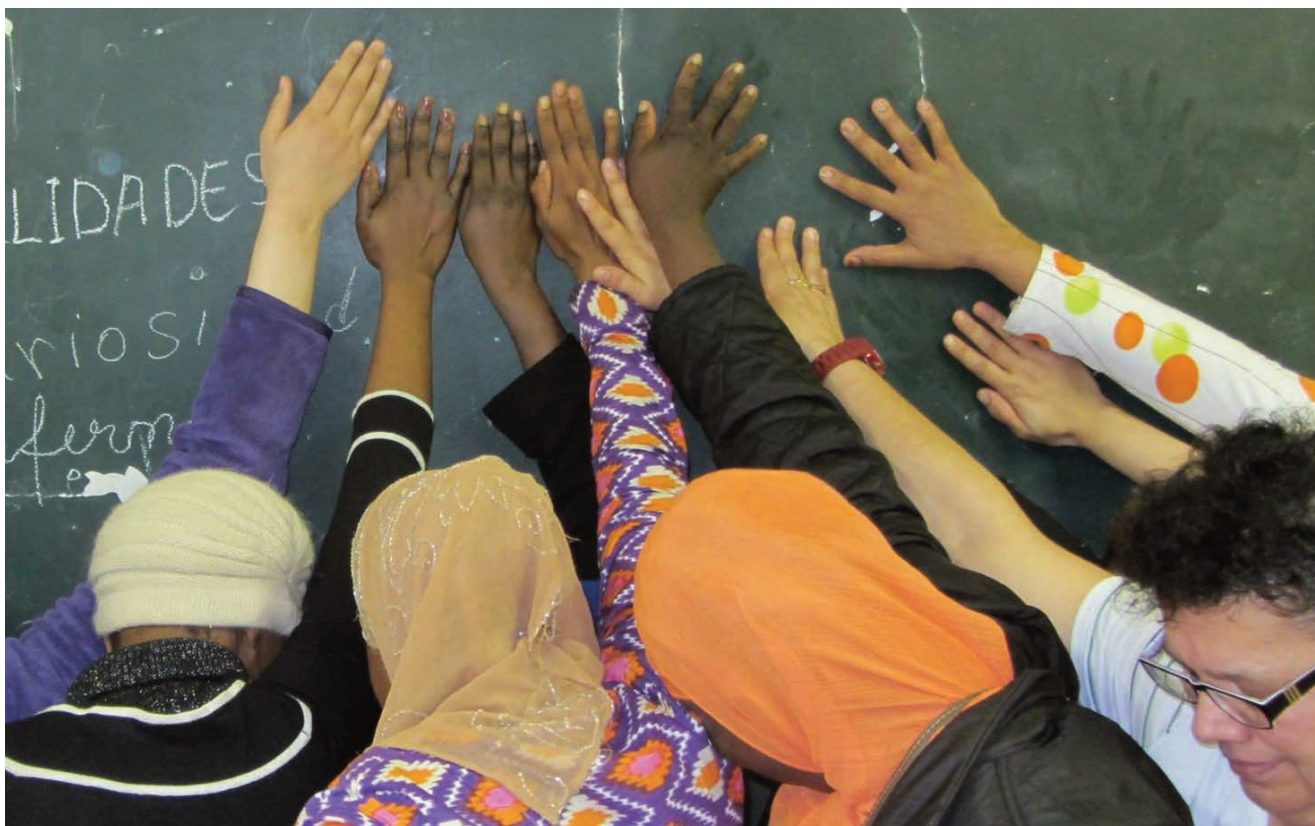
"Unión y fuerza", foto de Alicia García. Zaragoza. Dinámica realizada durante una de las clases de español del nivel intermedio alto. ¿Cómo simbolizar el significado de nuestras clases? Una imagen vale más que mil palabras...

comités y delegaciones, tanto en el número de personas que participa, como en sus edades y profesiones (aunque predominan las mujeres y personas vinculadas al ámbito educativo). Todo ello nos habla de una diversidad que enriquece la experiencia y las posibilidades de ser y estar como organización en la sociedad.