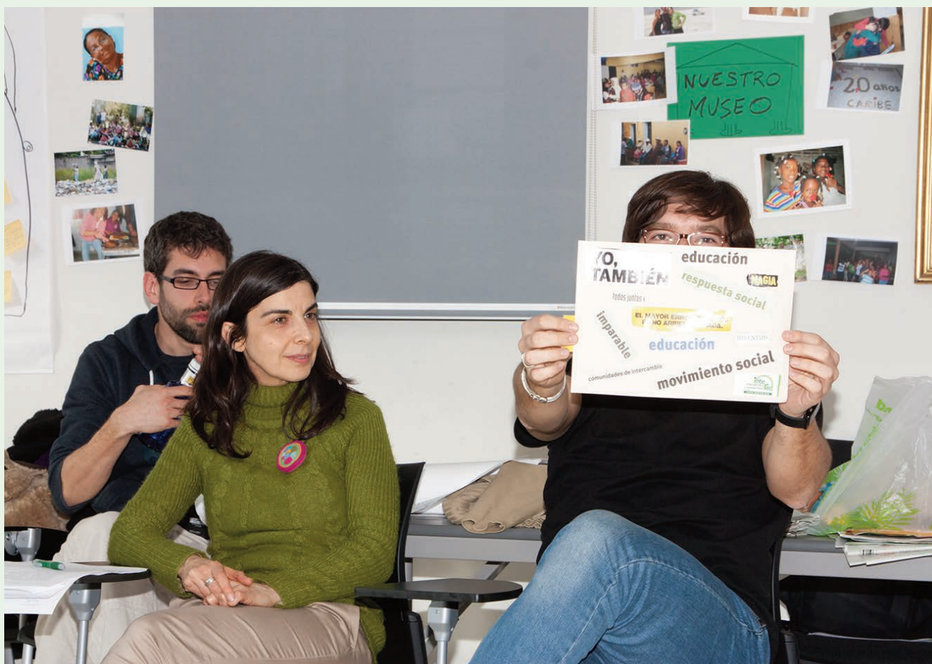
La autora del artículo en una formación de voluntariado.

motivaciones, para repetir una y otra vez que la tarea es una bellísima excusa para un encuentro entre iguales. Es maravilloso porque yo sé que no me creen, pero sé también que unos meses después la experiencia llegará con la rotundidad de la transformación, colocándonos en un nuevo lugar de interpretación y lucha.