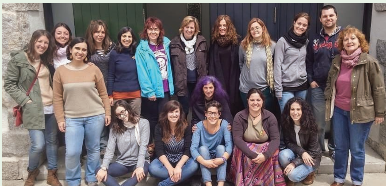
Encuentro de voluntariado internacional.

¿Se conoce fuera del tercer sector lo que hace una persona voluntaria en una ONGD? Como primera actividad del proyecto lanzamos estas preguntas a las ONGD y montamos un café tertulia para generar pensamiento acerca de estas cuestiones. Immanol Zubero (sociólogo y profesor de la Universidad del País