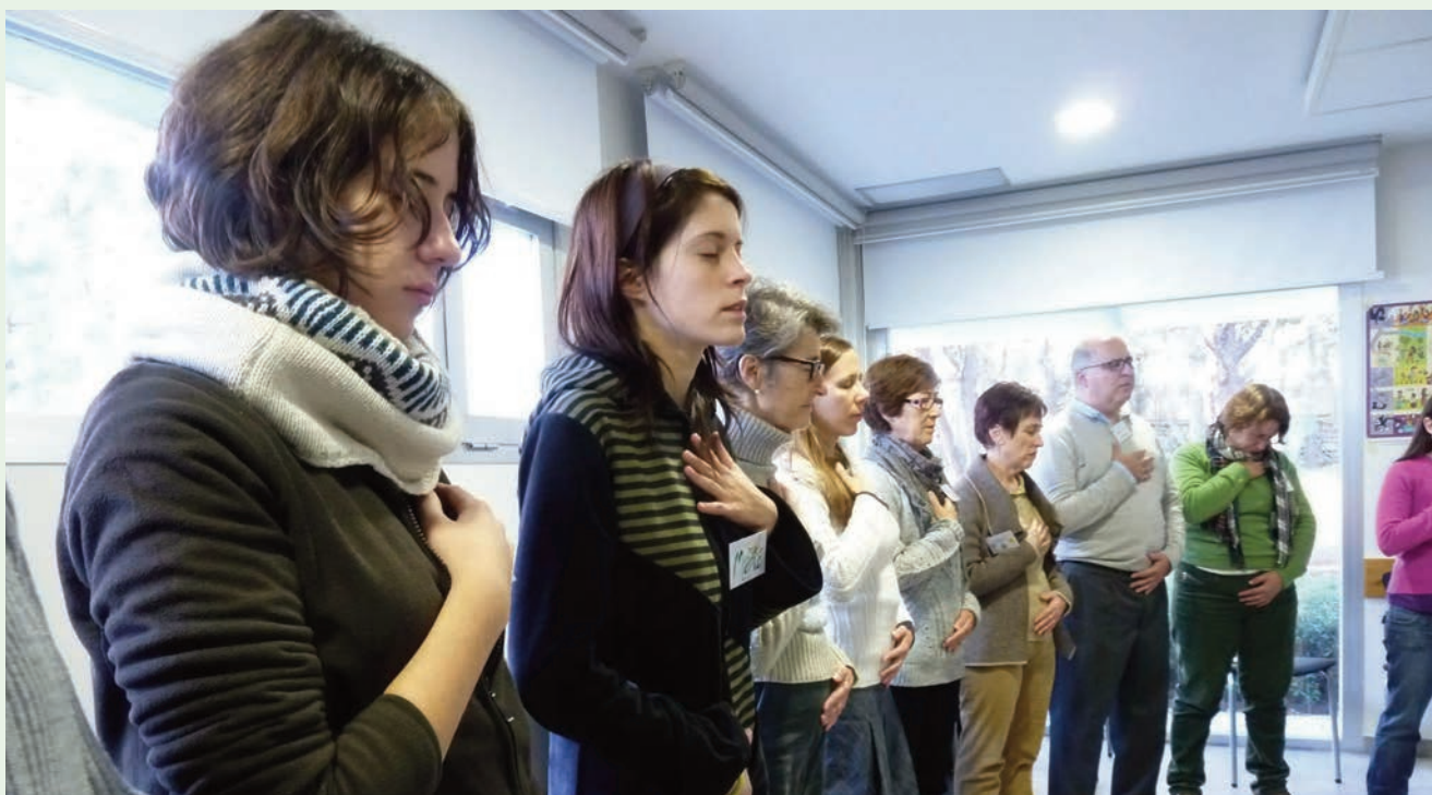
Talleres con responsables de voluntariado de InteRed.