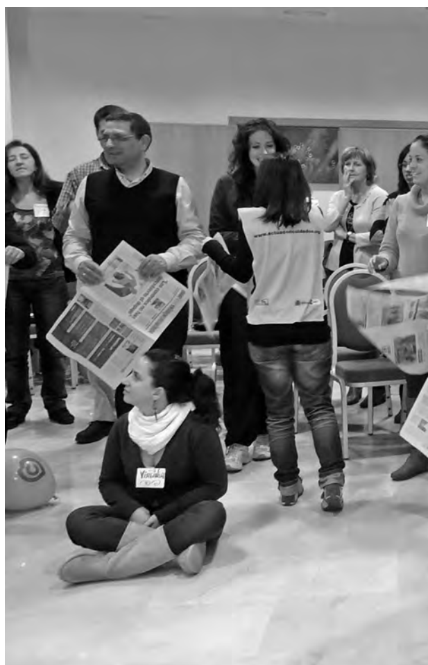
Segundo encuentro de profesorado en Madrid.

Agradecemos la alegría y motivación que las personas a las que se dirige la intervención (profesorado,