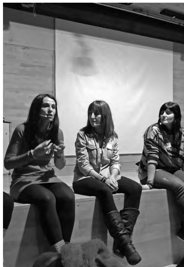
Presentación del documental en la Casa Encendida de Madrid.