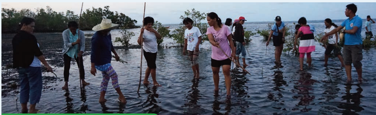
Pesca. Bicol – Sorsogon. Filipinas.