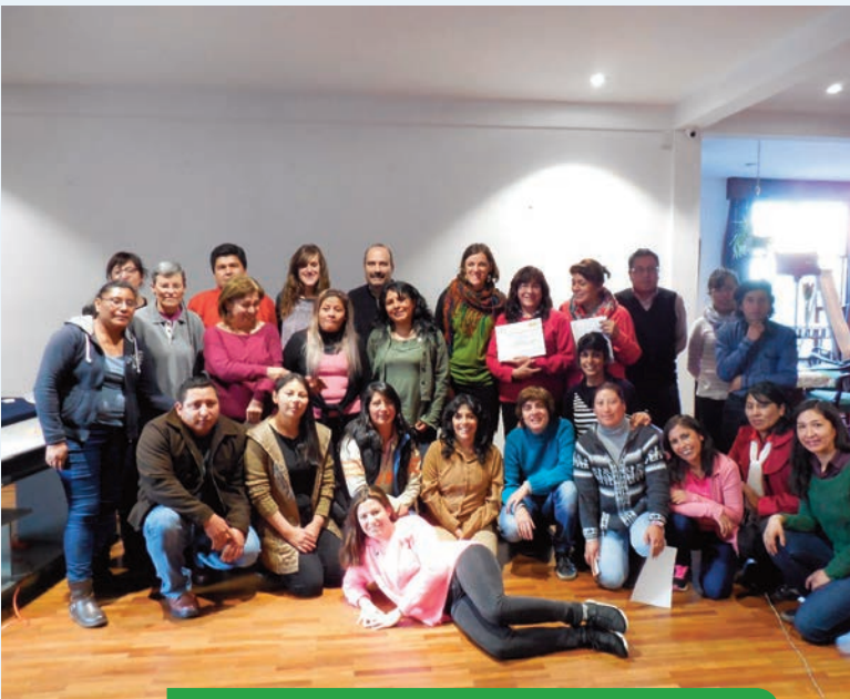
Participantes de un taller de género en Bolivia.

Se destaca el buen nivel de interlocución y trabajo compartido con autoridades municipales y de distrito. Sin embargo, se pone de manifiesto la dificultad de poder alcanzar acuerdos con autoridades educativas a nivel departamental y nacional, a pesar de los esfuerzos realizados por el equipo del Convenio. En el momento de la evaluación InteRed estaba en conversaciones con UNEFECO para la acreditación de procesos formativos dirigidos a docentes de primaria y secundaria. Así mismo, se destaca como positiva la conformación del “Comité Articulador” integrado por InteRed, Save The Children, la Campaña Boliviana por el Derecho a la Educación y Fe y Alegría, que tiene como finalidad dialogar con el Observatorio Plurinacional de Calidad Educativa para contribuir a la mejora del sistema de medición de la calidad educativa.