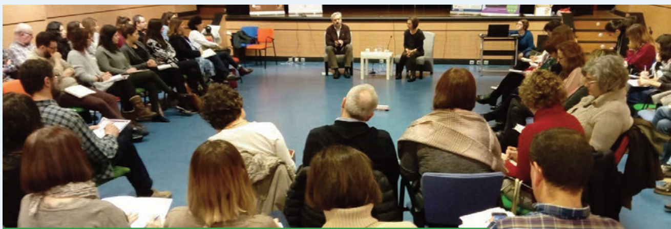
Encuentro territorial en Bilbao del Movimiento por una Educación Transformadora y la Ciudadanía Global.