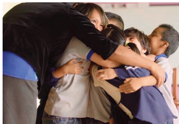
La importancia del abrazo. Fotograma del documental de InteRed “Pedagogía de los cuidados”.

En este documento también están recogidas siete experiencias escolares – 3 en Latinoamérica y 4 en Euskadi – que aportan experiencias, no solamente en el terreno de la sostenibilidad ambiental, sino también en el de la convivencia con las personas y su interioridad, con la idea de incentivar el cuidado de todos los seres vivos, humanos y no humanos, que habitan el único planeta del que disponemos. Todas estas experiencias, además, están recogidas en varios documentales: Pedagogía de los cuidados. Donde la vida es el centro .