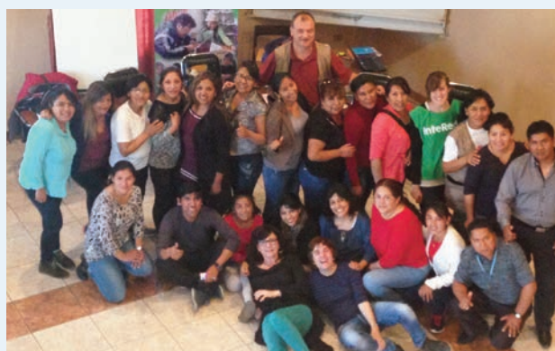
Foto de grupo del personal técnico de organizaciones locales e InteRed del Convenio con AECID. Cochabamba, Bolivia.

El gran logro de esta estrategia está siendo el fortalecimiento y la motivación para trabajar por la despatriarcalización de la educación que observamos