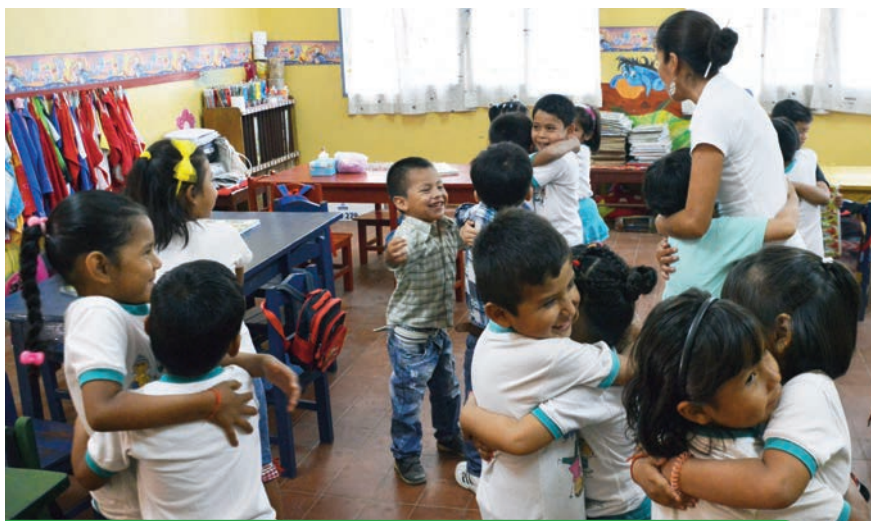
Centro de educación social y comunitario Madre India. Santa Cruz de la Sierra (Bolivia)

“La enseñanza que deja huella no es la que se hace de cabeza a cabeza, sino de corazón a corazón”.