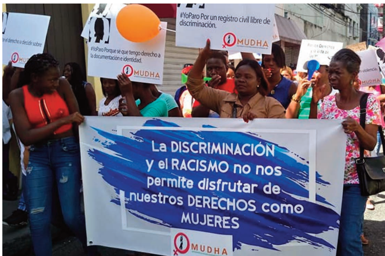
Mujeres reivindicando sus derechos.