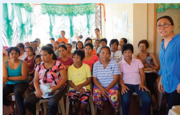
Formación. Bicol - Camarines del Sur (Tinawagan, Tigaon). Filipinas.

- Gobernabilidad: Promover la aplicación de la legislación vigente filipina para una efectiva participación de las personas de las comunidades vulnerables.