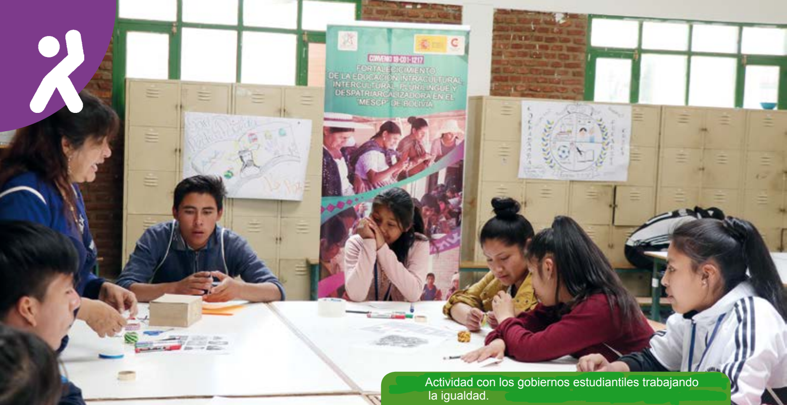
Actividad con los gobiernos estudiantiles trabajando la igualdad.