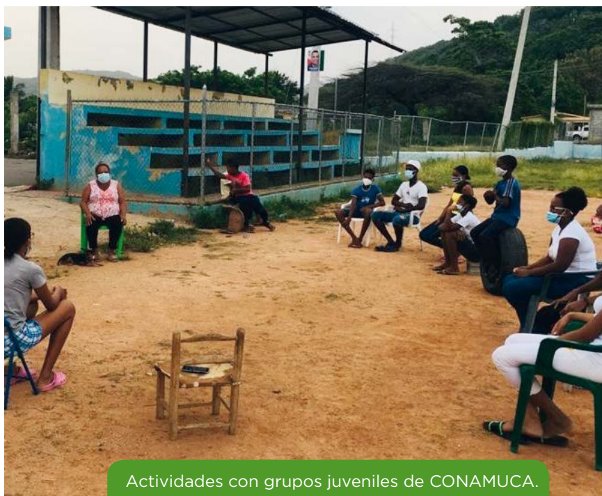
Actividades con grupos juveniles de CONAMUCA.

Ahora pensamos cómo abordar el tema de la sexualidad y la educación sexual, y estamos analizando cómo el confinamiento está afectando al embarazo temprano y a uniones tempranas en niñas y adolescentes de nuestras comunidades. Queremos ver cómo trabajar esta temática desde los grupos culturales, involucrar a los jóvenes, principalmente a los varones, donde encontramos resistencias. Nuestro país tiene la tasa más alta de embarazo en adolescentes de América Latina y el Caribe, el 20,5% de niñas y jóvenes de entre 15 y 19 años quedan embarazadas en la adolescencia. También es todo un reto involucrar a las familias, porque muchas veces son las que fuerzan las uniones prematuras y existen muchos tabúes para hablar de educación sexual para prevenir las violencias.