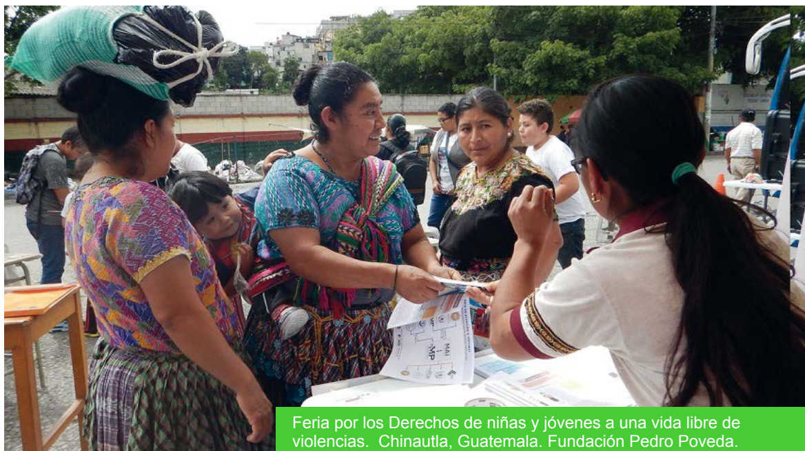
Feria por los Derechos de niñas y jóvenes a una vida libre de violencias. Chinautla, Guatemala. Fundación Pedro Poveda.

InteRed trabaja en Guatemala para contribuir al efectivo cumplimiento del derecho de niñas y mujeres indígenas y mestizas a una vida libre de violencias, a través del fortalecimiento de redes de atención del país y capacidades comunitarias, donde la formación de promotoras y docentes es clave.