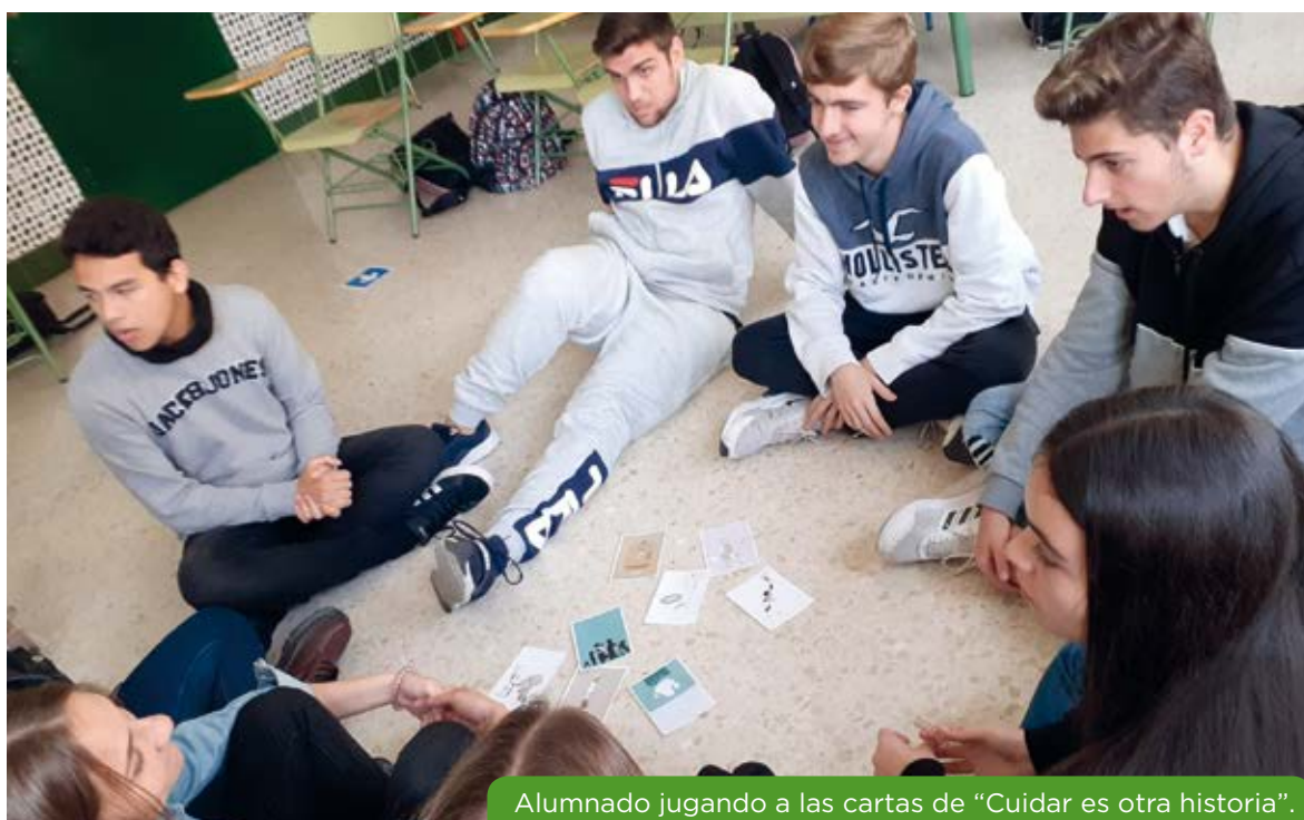
Alumnado jugando a las cartas de "Cuidar es otra historia".

Esta propuesta coeducativa se crea con el apoyo y compromiso del profesorado, alumnado, voluntariado y ONGD, y cuenta con la cofinanciación de la Junta de Andalucía a través de la Agencia Andaluza de Cooperación Internacional al Desarrollo.