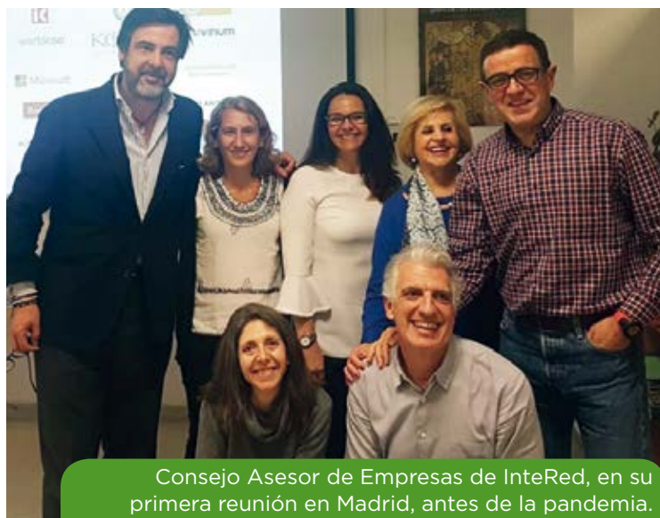
Consejo Asesor de Empresas de InteRed, en su primera reunión en Madrid, antes de la pandemia.

Este equipo surge de dos convencimientos: queremos que la empresa privada sea un actor aliado relevante para conseguir llevar adelante nuestra misión institucional, para lo que necesitamos diversificar nuestras fuentes de financiación de cara a una mayor sostenibilidad económica. Y queremos hacerlo apostando por la construcción de alianzas estratégicas con empresas, aprendiendo de personas empresarias cercanas a InteRed, que nos pueden asesorar en este camino.