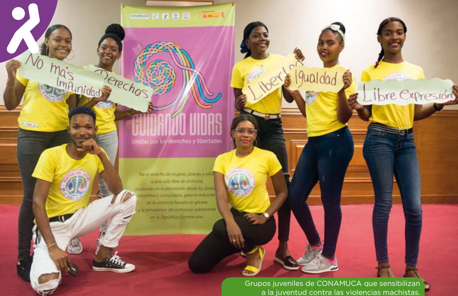
Grupos juveniles de CONAMUCA que sensibilizan a la juventud contra las violencias machistas.