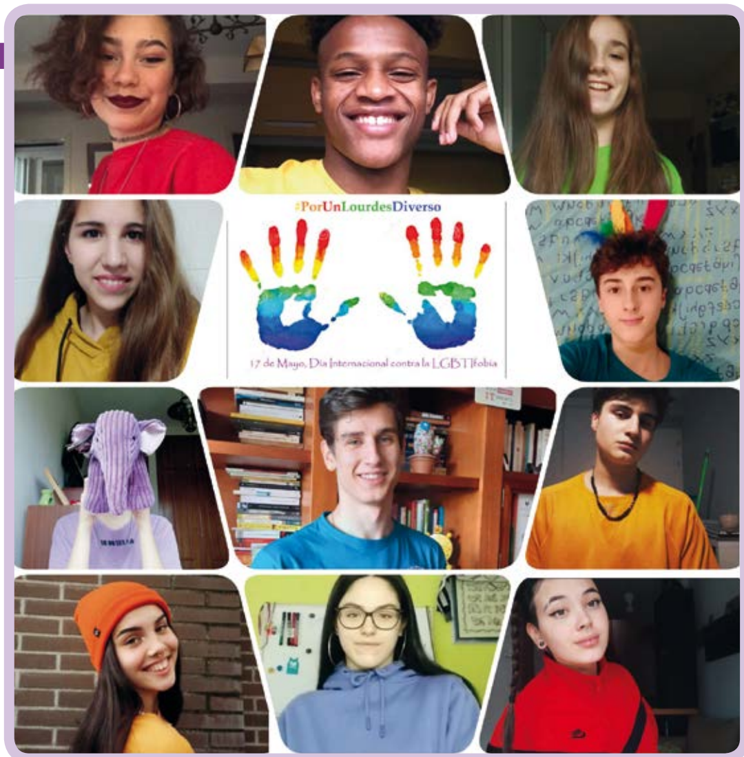
Acción para el día contra la LGBTIfobia creada por el grupo del colegio Lourdes de Madrid.