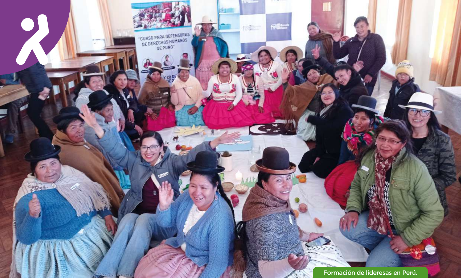
Formación de lideresas en Perú.