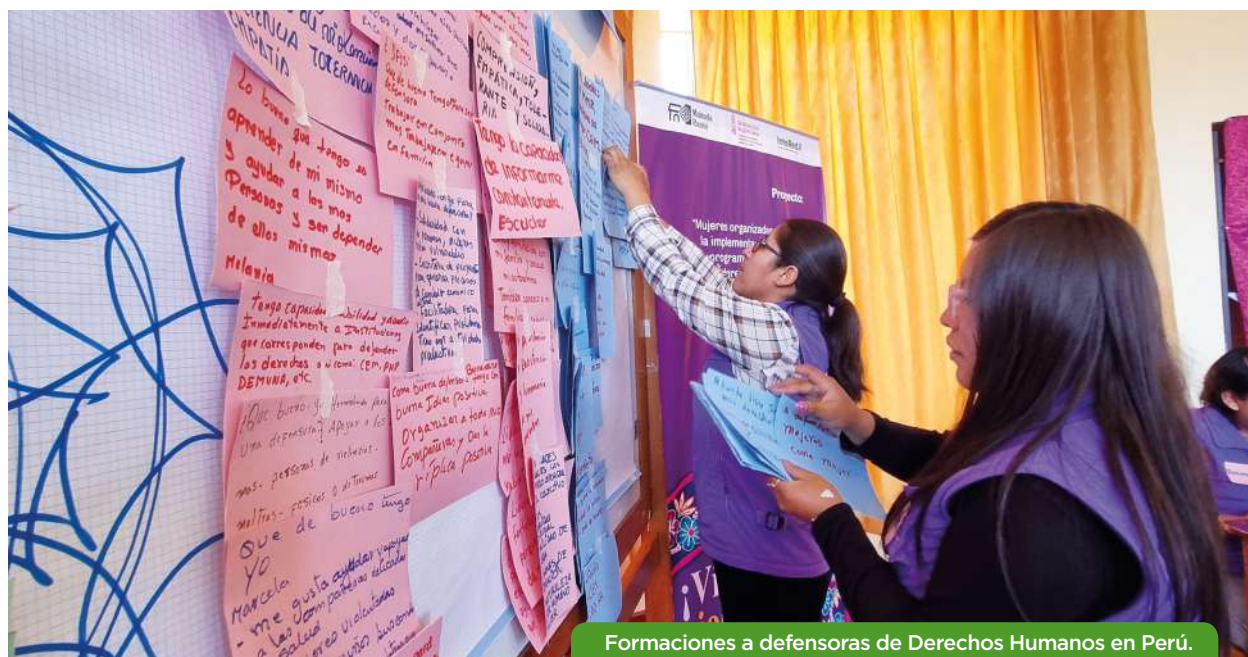
Formaciones a defensoras de Derechos Humanos en Perú.

En cuanto a la violencia de género, existen altas tasas de prevalencia de la violencia contra las mujeres según el Instituto de Estadística Peruano: 57,7% a nivel nacional; y en las regiones de Apurímac, Huancavelica y de Puno con el 72,8%, 67,3% y 63,4% respectivamente. Siendo las prevalencias por tipo de violencia: psicológica: 52,8%, física: 29,5% y sexual: 7,1%.