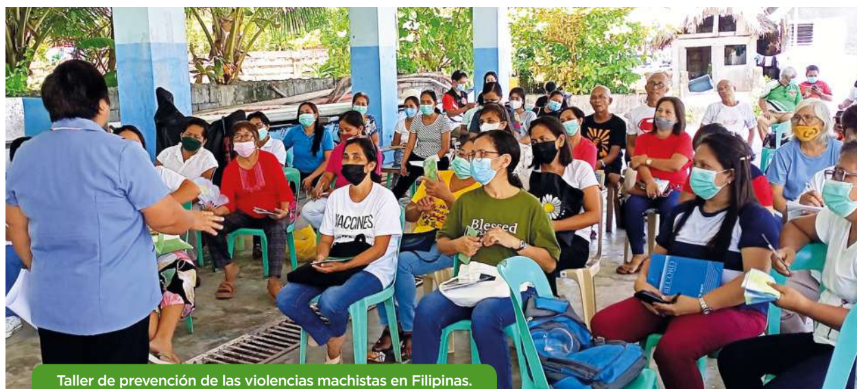
Taller de prevención de las violencias machistas en Filipinas.

dades sociales, dando lugar a violencias, incluida el asesinato, racismo, discriminaciones de todo tipo, pobreza extrema, xenofobia... haciendo patente la necesidad de una educación en DDHH y democracia .