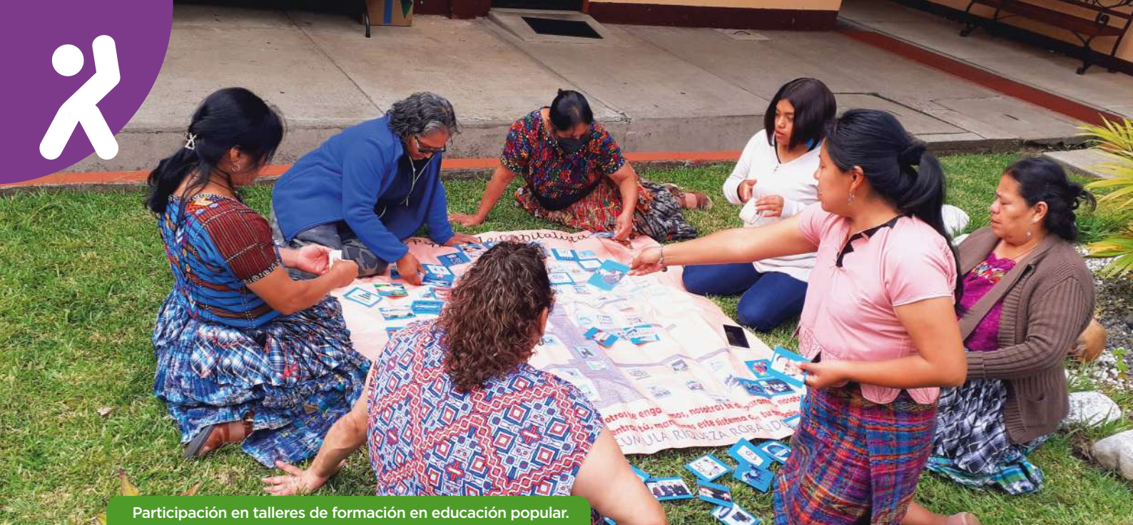
Participación en talleres de formación en educación popular.