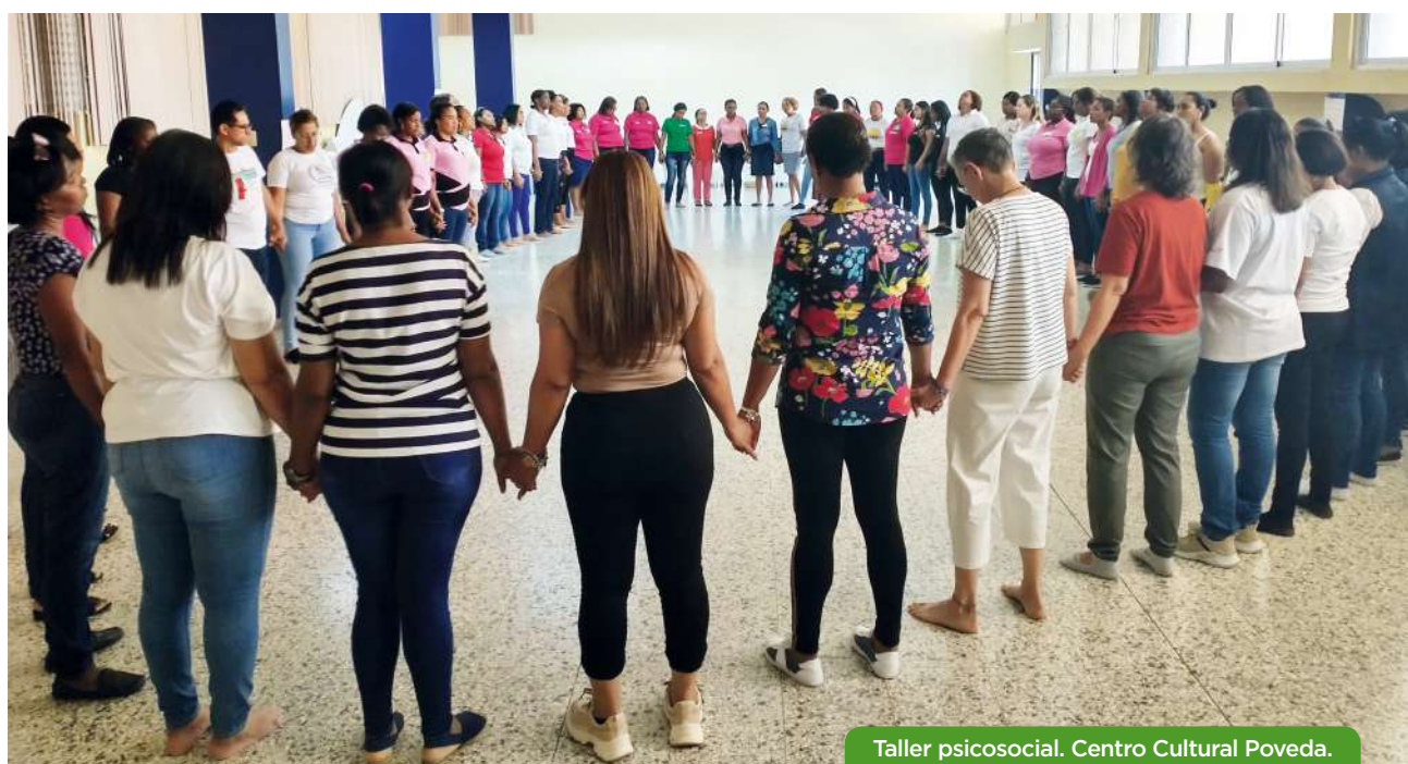
Taller psicosocial. Centro Cultural Poveda.

der salir de la situación y reconstruir su vida. Sin embargo, muchas veces pasamos por alto a las personas que se encargan de su bienestar y protección. Las personas que cuidan y apoyan a otras mujeres, necesitan para desempeñar su labor, cuidados psicosociales , que garanticen su salud emocional y reciban capacitación constante sobre estrategias de cuidado personal y colectivo, dado que manejan situaciones traumáticas; por ello, es esencial que cuenten con espacios de confianza, confidenciales y seguros que les permitan procesar sus emociones y experiencias de forma saludable: que se sientan escuchadas y validadas en su trabajo para evitarles ansiedad, impotencia, agotamiento emocional, digerir vivencias y puedan gestionar su bienestar mental y seguir denunciando y defendiendo derechos.