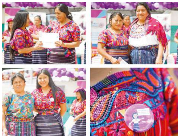
Entrega de certificados a mujeres artesanas en la escuela de tejidos

En ese contexto de desprotección, desvalorización y explotación del trabajo de las mujeres mayas tejedoras se visibiliza la importancia de este trabajo, el cual permitirá seguir encaminando las acciones políticas y organizativas de los Consejos de Tejedoras y del Movimiento Nacional de Tejedoras para proteger el derecho a la propiedad intelectual colectiva de los pueblos indígenas, la cual está contenida en los conocimientos, tejidos e indumentaria maya.