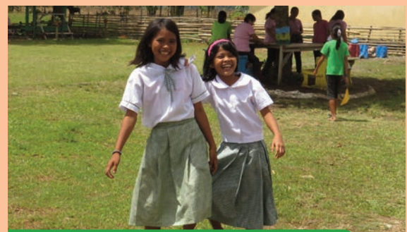
Barangay Cubo, Esperanza, Agusán del Sur (Filipinas).

El Convenio implementado por InteRed, Codspa y FRS ha permitido que esta escuela incluya en su programa educativo distintos simulacros y acciones esenciales para crear una cultura de prevención; cultura necesaria para fortalecer las capacidades de los habitantes de los barangays porque, como decían algunos de sus profesores, después de la tormenta siempre viene la calma. Y mientras tanto, nunca hay que perder la esperanza.