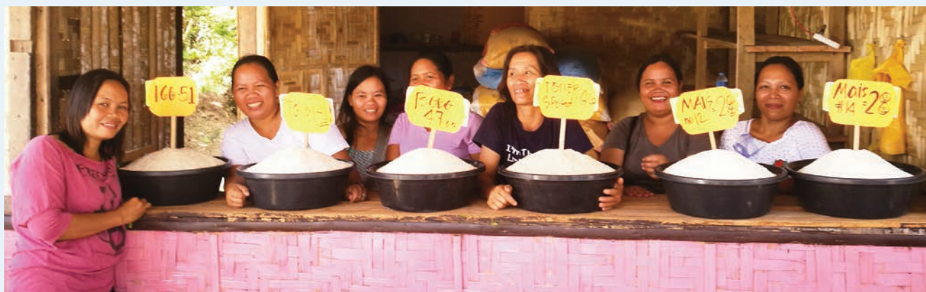
Mujeres con emprendimientos agrícolas. Barangay Tindahan. Asociación de mujeres de Katipunan, Veruela, Agusán del Sur. Caraga (Filipinas).

En Filipinas, InteRed trabaja con dos socios locales (SIKAP y SSAFI). En Lagonoy, a través de las Siervas de María Ministras de los Enfermos, socio local de FRS, el convenio trabaja mejorando la situación sanitaria y alimentaria de la población de los distintos barangays donde InteRed desempeña su actividad. Por su parte, Sorsogon Social Action Foundation, Inc. (SSAFI) inició su andadura en 1995 en Sorsogón centrándose en mejorar las situaciones de pobreza extrema de las comunidades afectadas por desastres. Al igual que SIKAP, organización que trabaja en la isla de Mindanao.