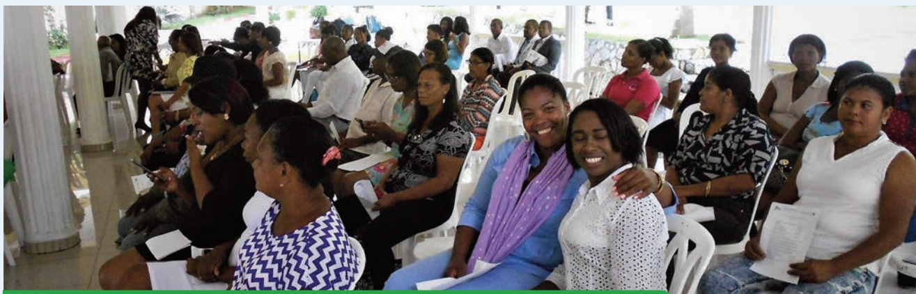
Clausura de curso 2017-2018 de la escuela de formación política. República Dominicana.

Esta Escuela de Formación Política se encuentra dentro del proyecto para el “fortalecimiento de la participación política de la sociedad civil organizada para una gobernabilidad democrática en 7 provincias de la República Dominicana, con énfasis en el empoderamiento de mujeres, niñas, niños y jóvenes” . Dentro de este mismo programa se ha realizado el II Plan Municipal de Villa Altigracia , un instrumento que establece los objetivos, las áreas de acción prioritarias, el seguimiento y evaluación de la estrategia municipal con vistas al futuro y cimentado sobre seis ejes prioritarios: el económico, género y equidad, gobernabilidad, población, medio ambiente y urbanismo. Así, el Centro de Planificación y Acción Ecuménica CEPAE, desde la coordinación de Planes Municipales participativos; y CONAMUCA, se unen con el propósito de fortalecer la participación social y política de las mujeres en la sociedad civil organizada.