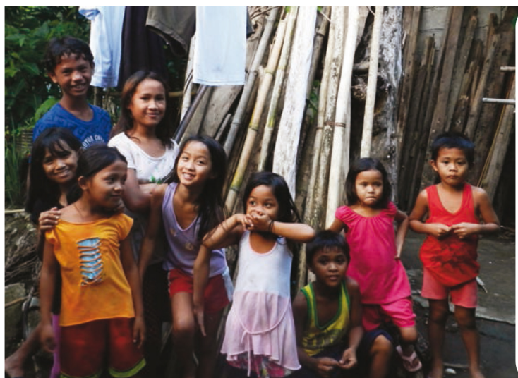
Niños y niñas de diferentes barangays (barrios). Manamoc, Camarines Sur. Lagonoy (Filipinas).

“¿Dónde comienzan los derechos humanos? En los pequeños lugares, cerca de casa y tan pequeños que no pueden verse en los mapas del mundo. Sin embargo, constituyen el universo de cada persona. Estos son los lugares en los que cada hombre, cada mujer y cada niño y niña busca una justicia equitativa, igualdad de oportunidades, una dignidad igual sin discriminación alguna”.