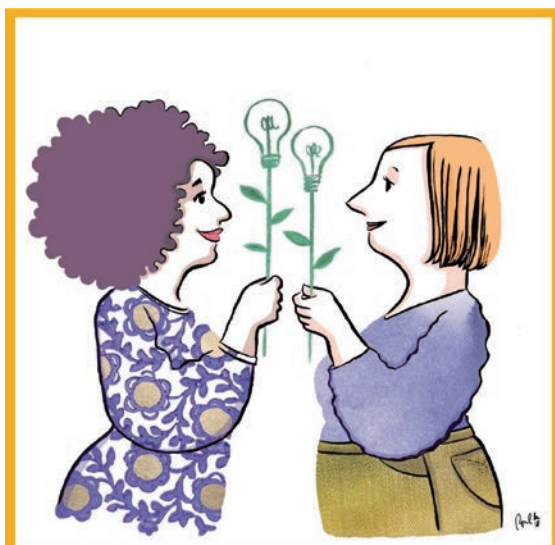
ODS 7: Energías renovables. Ilustradora: Raquel Gu.

Las mujeres han sido claves portadoras de sabiduría ancestral en la agricultura tradicional y la economía de subsistencia. A la vez, las mujeres son las más afectadas por la pobreza y el hambre, las más perjudicadas en situaciones de crisis y conflictos, las más desprotegidas en derechos en muchos territorios, como el derecho a la propiedad, al crédito o a la herencia, las que corren peligro en muchas situaciones debido a los conflictos armados, la trata de personas, los feminicidios o los desplazamientos forzados. Al mismo tiempo, las mujeres desarrollan en todos los ámbitos mecanismos de supervivencia, resiliencia y resistencia que es preciso conocer y resaltar, algunos de ellos reflejados en el estudio, que nos marcan hojas de ruta por las que buscar alternativas a este modelo neoliberal destructivo para la naturaleza y las mujeres.