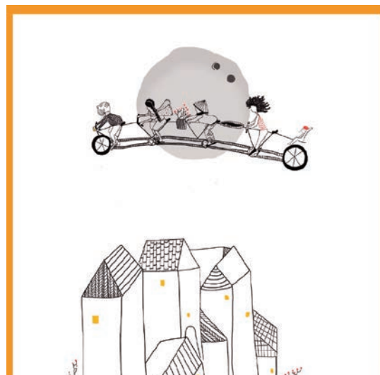
ODS 11: Ciudades y comunidades sostenibles. Ilustradora: Joly Navarro.

Nos encontramos ante una coyuntura idónea en la que sabernos parte de una ciudadanía global nos permite aliarnos, comprender las problemáticas globales y situarnos en nuestra responsabilidad individual. Necesitamos, por tanto, conocer la realidad de la situación y reclamar a los gobiernos y entidades públicas, pero también a las empresas y poderes fácticos, la consecución de alternativas que pongan la vida (y no al mercado) en el centro, reclamando vidas dignas para todas las personas del planeta y no únicamente para un grupo privilegiado. Debemos dejar de negarnos a nuestra capacidad de hacer y cambiar las cosas, podemos cambiar de paradigma bajo una cultura de paz y sostenibilidad.