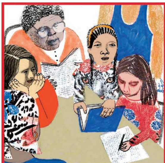
ODS 4: Educación de calidad. Ilustradora: Ana Penyas.

territorios, en organizaciones de barrio, en las luchas no violentas. Además, en la conservación de semillas, la denuncia de los abusos de las grandes corporaciones, la protección de los bosques y, en general, de la vida.