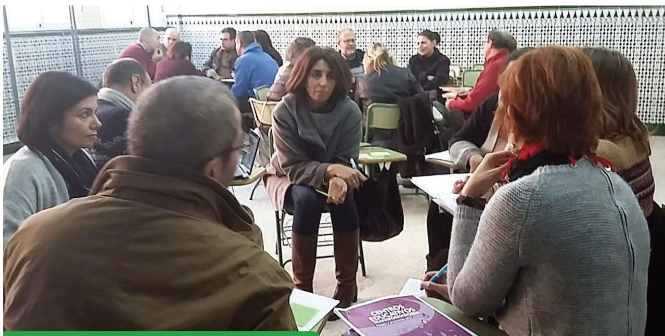
Sesión de trabajo con redes de profesorado.

Técnica de Educación para el Desarrollo (InteRed Andalucía)