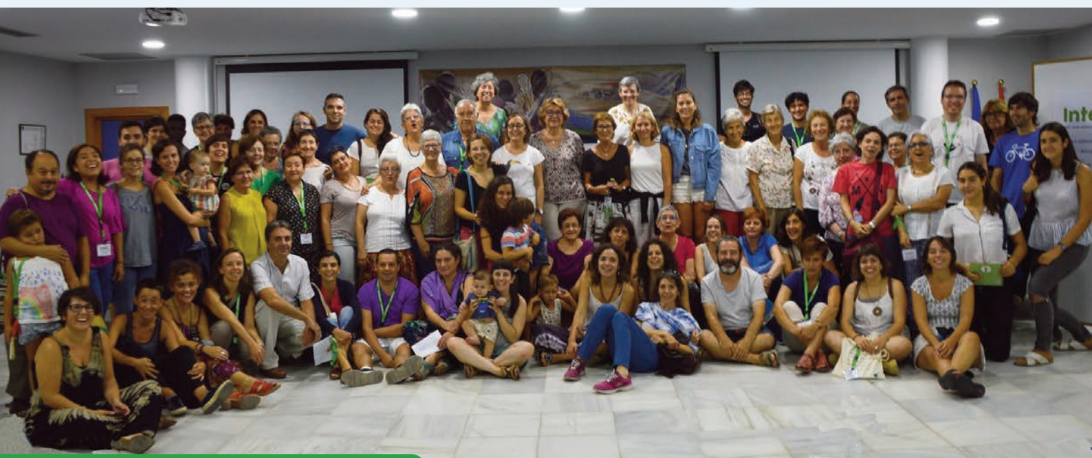
Foto de grupo de las jornadas de InteRed del 2018.