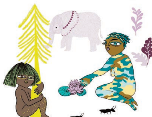
Portada de estudio. Ilustradora: P.nitas.

consumidores y contaminantes y actuar para solventar la situación.