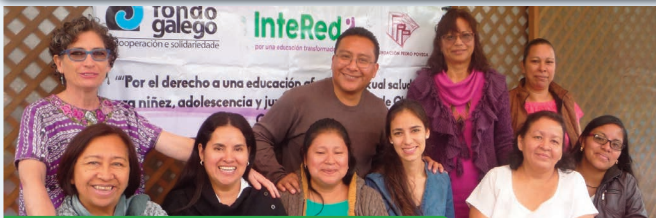
Actividad con jóvenes en Chinautla. Ciudad de Guatemala. Fundación Pedro Poveda. Fondo Galego.

Ha sido realizado con el apoyo financiero de la Agencia Española de Cooperación Internacional para el Desarrollo (AECID), con cargo al proyecto "Construyendo ciudadanía global desde los centros de educación formal, en el marco de la Agenda 2030 y los ODS".